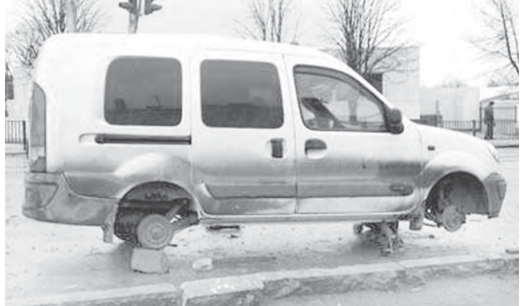
● На таком авто далеко не уедешь.

Как рассказали в отделе вневедомственной охраны при УВД г.Магнитогорска, по данному факту было возбуждено уголовное дело.