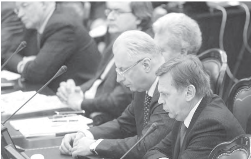
● Совет законодателей забраковал проект закона об образовании.

На общественное обсуждение была внесена уже вторая версия законопроекта, доработанная в Минобрнауки России, сообщил заместитель министра образо-