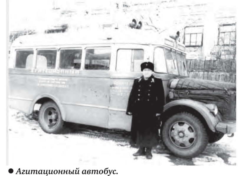
● Агитационный автобус.