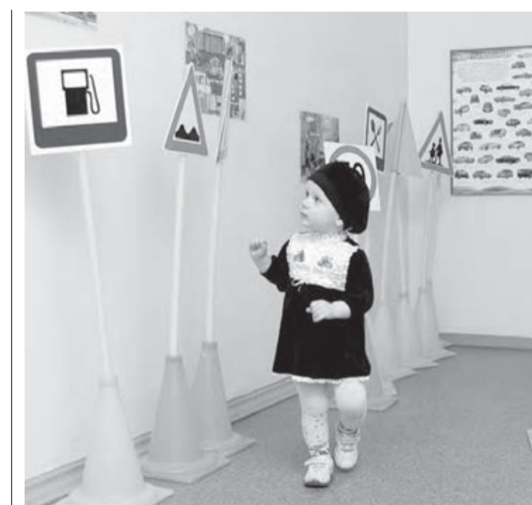
● Учте ПДД с детских лет.

К большому сожалению, очень часто пешеходы, осо-