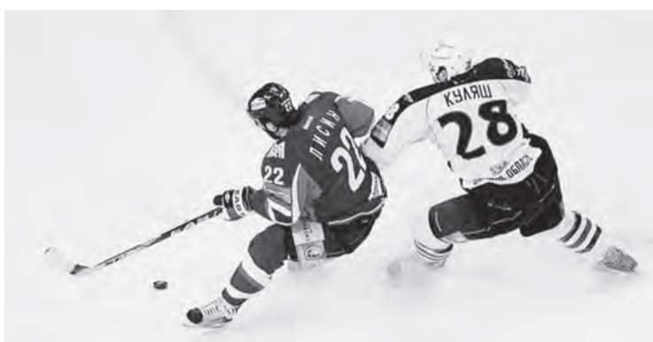
• В общий счет серии.

Ни у кого из болельщиков язык не повернется сказать, что «Металлург» проиграл. Не будем вдаваться в подробности этой игры, заметим лишь, что в овертаймах итог зависит не только от хоккеистов и тренеров. К сожалению, на льду кроме них есть еще специальные обученные люди, которые должны профессионально относиться к своим обязанностям. Трижды удалять хозяев в овертаймах при одном удалении соперника – это, честно говоря, перебор. Данный матч вошел в историю не только благодаря своей продолжительности (был побит рекорд матча «Ак Барс» - «Барыс» – 104 минуты 39 секунд от 11 марта 2010 года). Омск