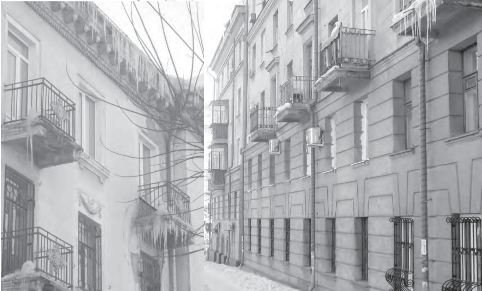
«Снег башка попадет – совсем мертвый будешь...» – к сожалению, веселая фраза из фильма в жизни не так уж и занята.