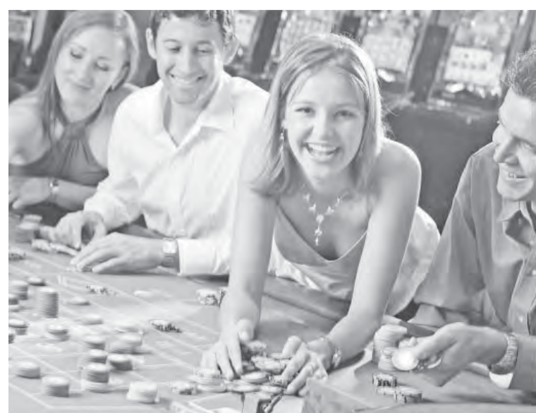
● Подпольные казино – это совсем не весело.

«Мы приняли жесткий закон, но, к сожалению, активность тех, кто пытается замаскировать игорный бизнес под какие-то другие виды деятельности, разрешенной законом, просто фонтанирует», – считает Дмитрий Медведев. Он обратил внимание Генпрокуратуры на сайт, который называется «Де казино». В нем огромное ко-