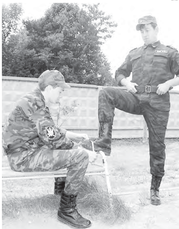
«А подрай-ка дедушке сапожок, салажонок!»

Между тем, Министерство обороны РФ установило личную ответственность высшего командного состава за неуставные отношения. С 1 декабря 2010 года в вооруженных силах стра-