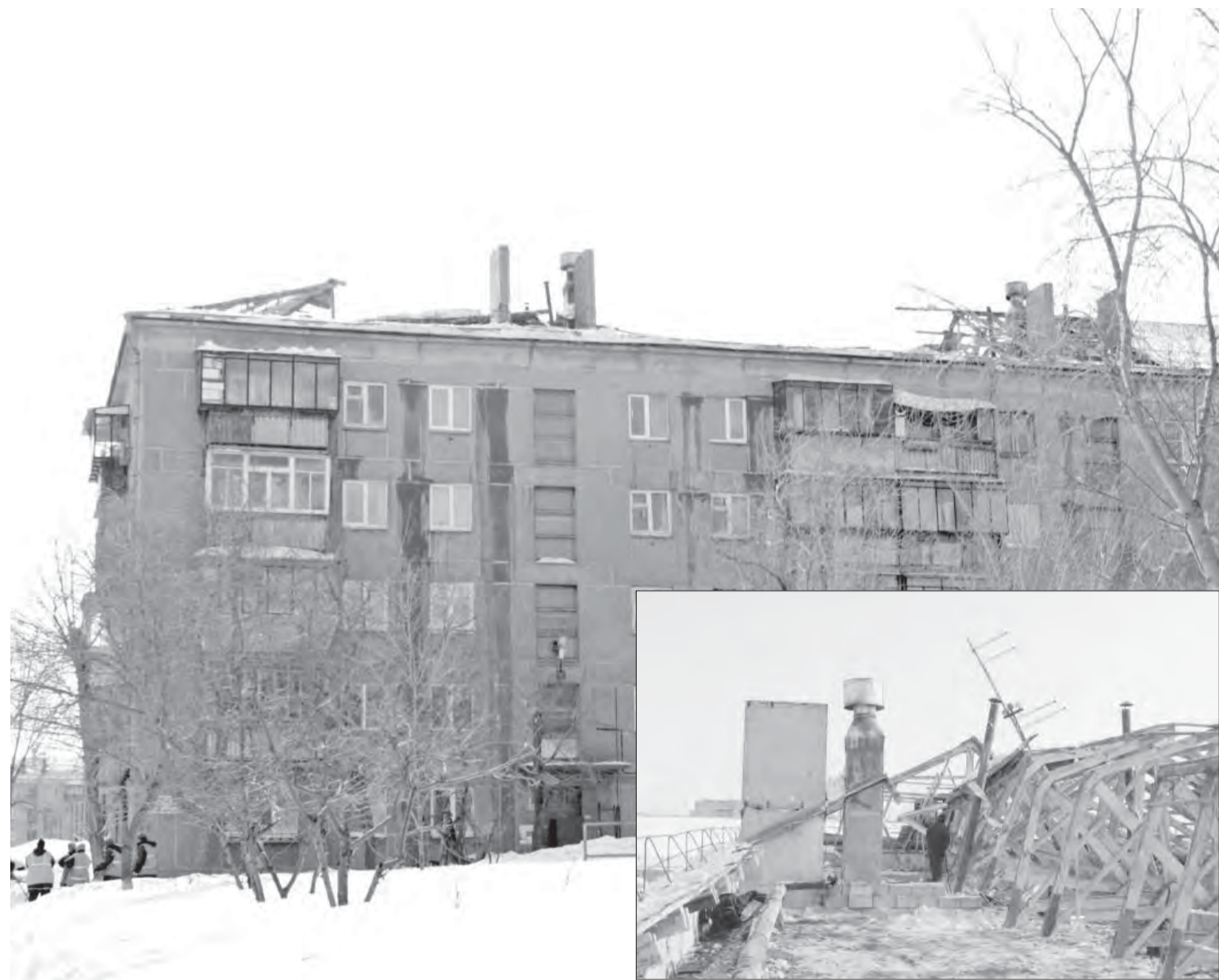
● Дом, у которого снесло крышу, может оказаться не единственным.