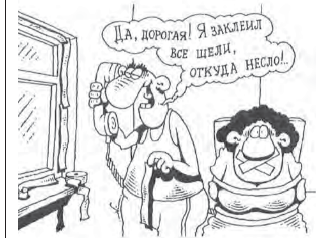
Рисунок Игоря КИЙКО