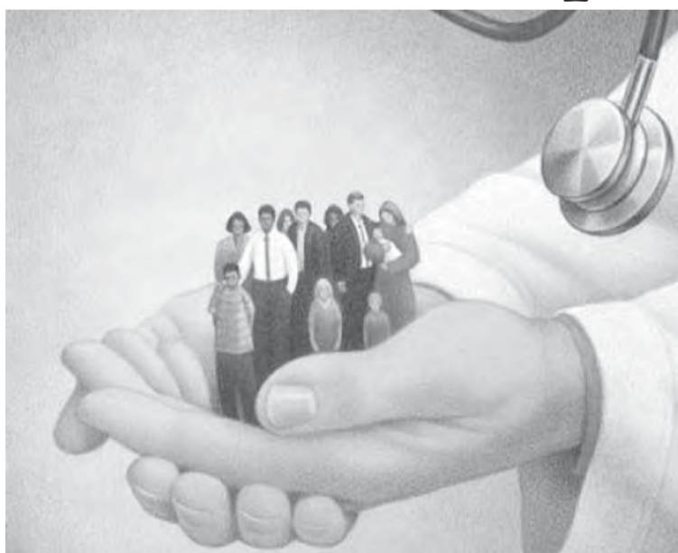
Нельзя делить пациентов на «наших» и «не наших».

Через неделю вступает в силу новый закон об обязательном медицинском страховании. В законе содержится несколько принципиальных новаций. Так, теперь россиянин может получить медицинскую услугу по полису ОМС в любом регионе страны, а не только по месту регистрации. Кроме того, получить бесплатную помощь можно будет не только в государственном и муниципальном медучреждении, но и в частном или ведомственном, если оно станет участником программы обязательного страхования. Человек может самостоятельно выбрать страховую медицинскую компанию, медучреждение и врача, которые будут его обслуживать. Работодатель не будет обеспечивать своих работников медицинскими полисами. Теперь это будет обязанностью самого работника – он должен будет выбрать страховую медицинскую компанию, написать заявление на обслуживание и потом забрать медицинский полис. Платить человек ничего не будет, эта обязанность сохраняется за работодателем.