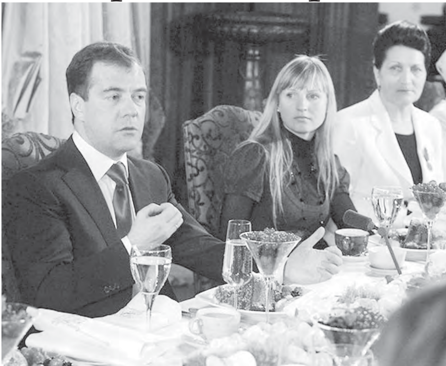
●Фото с сайта kremlin.ru. За чашкой чая с Президентом.