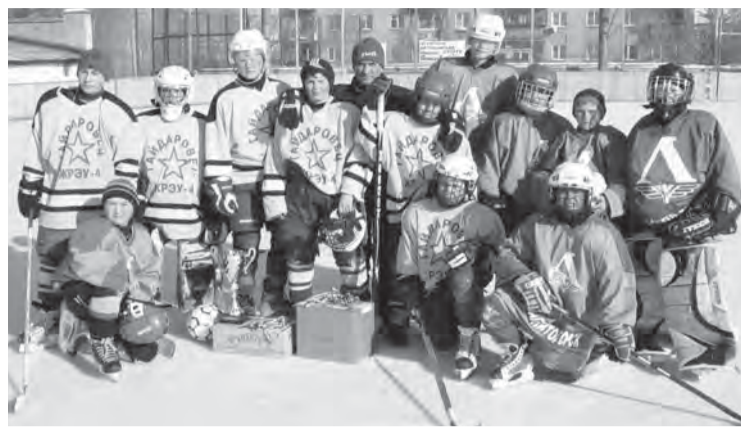
• Команда «Гайдаровец» - чемпион.

В соревнованиях, посвященных бывшему начальнику ЖКО-1 и состоявшихся уже в одиннадцатый раз, приняли участие шестнадцать команд. Часть матчей пришлось перенести из-за нагрянувших морозов. Однако без исключения из правил не обошлось. На хоккейной коробке двенадцатого участка таких переносов не было. Мальчишки-леновобережники из поселка Железнодорожников