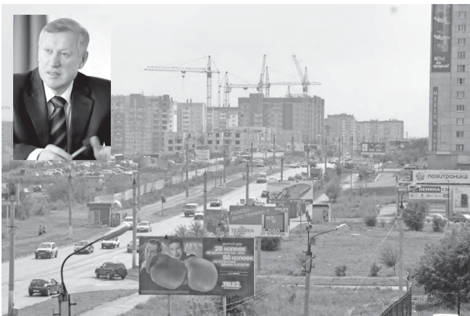
• Для главы такого крупного города как наш особенно важно наладить обратную связь с его жителями.