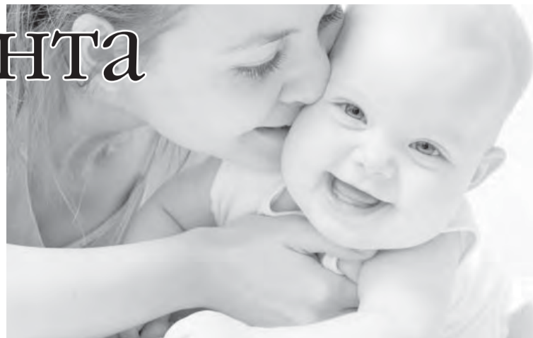
● Президент пообещал, что вернется к вопросу о начислении трудового стажа за воспитание детей

«Я поручу Минздравсоцразвития вернуться к этим вопросам. Вопросы начисления стажа должны быть более гибкими», – не отказал женщинам президент. Медведев также пообещал подумать над идеей выдачи многодетным семьям льготных медицинских полисов за счет регионов.