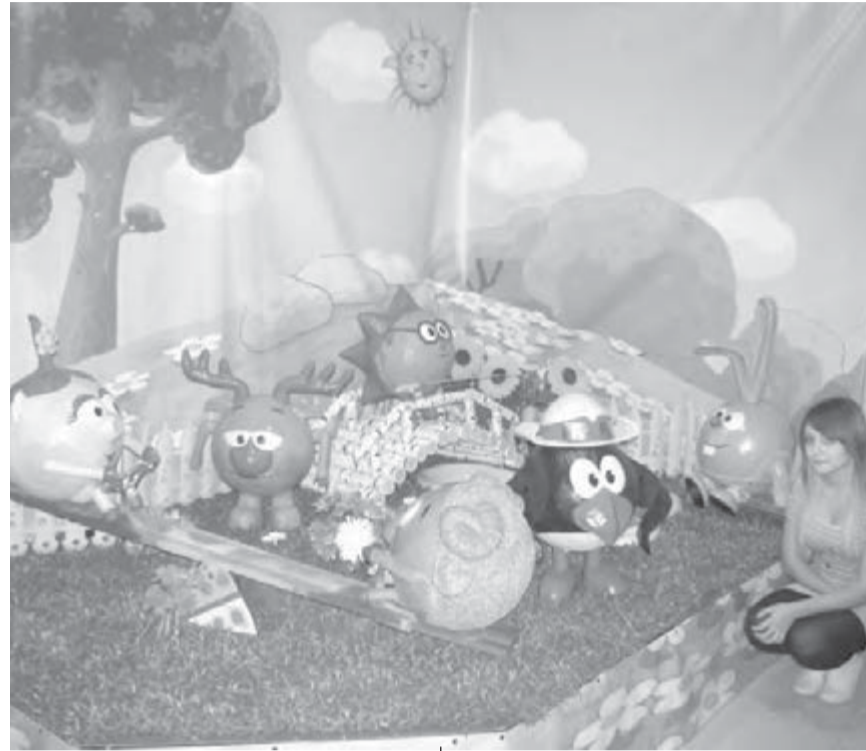
«Смешарики» в краеведческом музее.