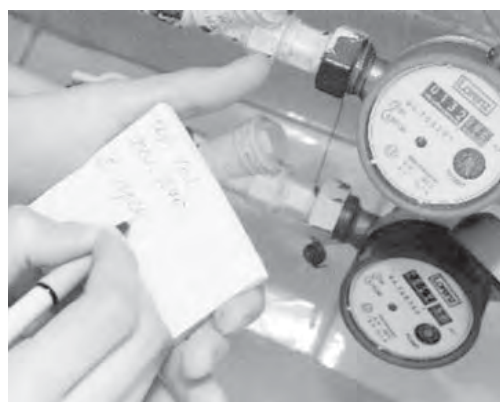
● Счетчики – не догма...