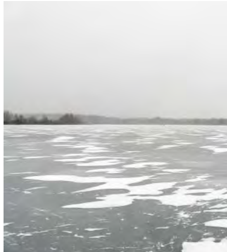
ловли рыбы, не предъявил, но заявил, что составит протокол.

изредка стали поклевывать ерши и небольшая плотичка. Вдруг благостную тишину нарушил рев снегохода. Ни вам «здрасьте», ни «до свидания». У мужчины, который представил позднее сторожем водоема, для нас нашлось только одно: «Убирайтесь отсюда, озеро хозяйское, ловля здесь запрещена!» Мы попросили его предъявить какие-либо документы, подтверждающие запрет. Никаких ведь аншлагов на подъезде к озеру и на берегу, запрещающих рыбалку на водоеме, нет. Документы «сторож» не предъявил, а вот вызвать для разборки «ребят» пообещал. Потом стал угрожать, что приедет милиция и мы будем жалеть, что попали сюда. Через полчаса, действительно, подъехал милиционер, который также никаких документов, подтверждающих запрет