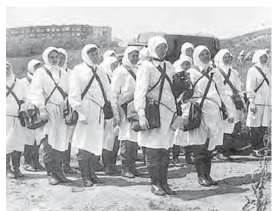
● Всегда на чеку!

За прошедшие годы гражданская оборона в нашей стране прошла большой путь становления и развития, превратилась в важную составляющую часть общегосударственных оборонных мероприятий. Первоначальным назначением гражданской обороны была защита мирного населения в условиях военных действий. И сейчас слова «гражданская оборона» простой гражданин воспринимает исключительно как символ военного времени. Но, к сожалению, и в мирной жизни происходит много чрезвычайных ситуаций, часто бывающих последствиями техногенных катастроф, природных катаклизмов, международного