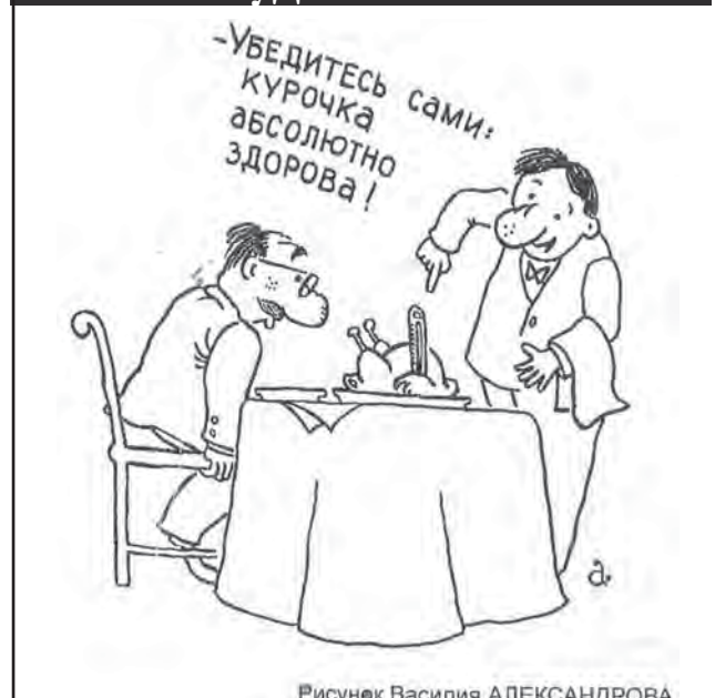
Рисунок Василия АЛЕКСАНДРОВА