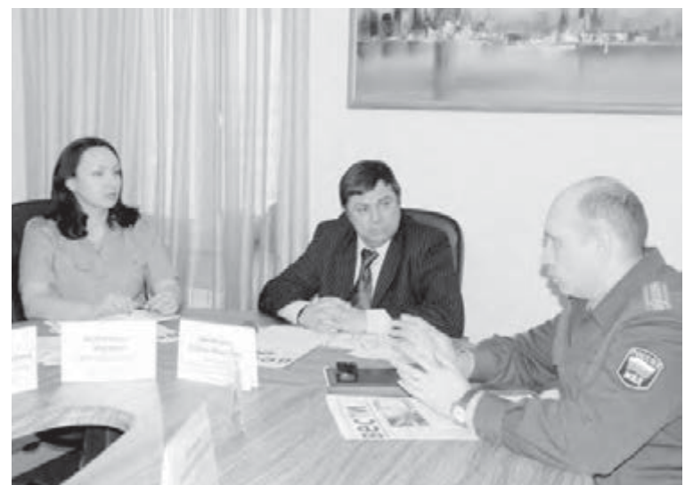
● Таможенникам за державу просто обидно.

Герман Иванович сообщил о результатах работы отдела экспертизы контрафактной продукции МТПП, куда по-прежнему часто поступают на экспертизу диски, одежда, обувь, упаковка, растет количество экспертиз программистов. Представители городских предприятий и организаций все чаще обращаются на предмет определения признаков контрафактности кондитерских изделий, строительных материалов.