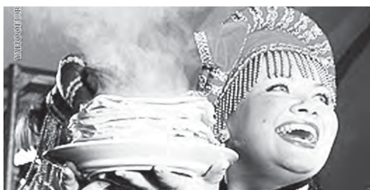
• Масленица зиму провожает.

С 27 марта по 2 апреля – Крестопоклонная неделя.