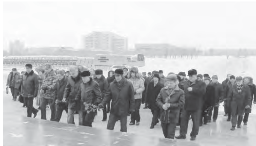
● Венки к подножию монумента «Тыл и фронт».

Ежегодно в январе проводится посвящение в рабочий класс. Руководители ММК, цеховых и производственных служб рассказывают будущим металлургам о