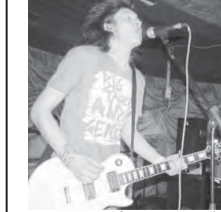
«Поп-Корн» для ценителей панк-рока.

Рекламу запретили, и мы ее не увидим у себя по телевизору, но позитивных участников группы это не очень-то и расстроило.