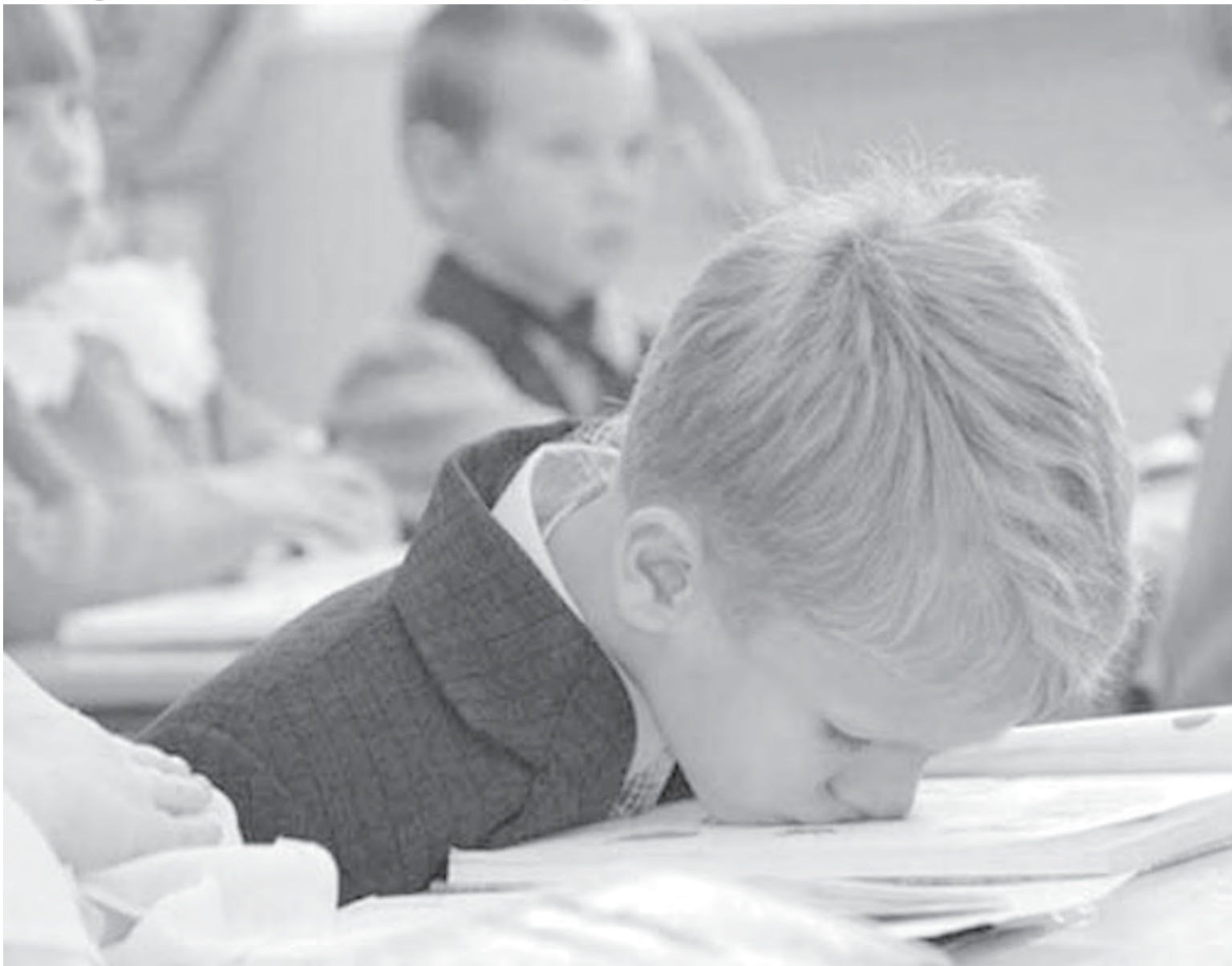
• Нагружать все меньше нас стали почему-то...