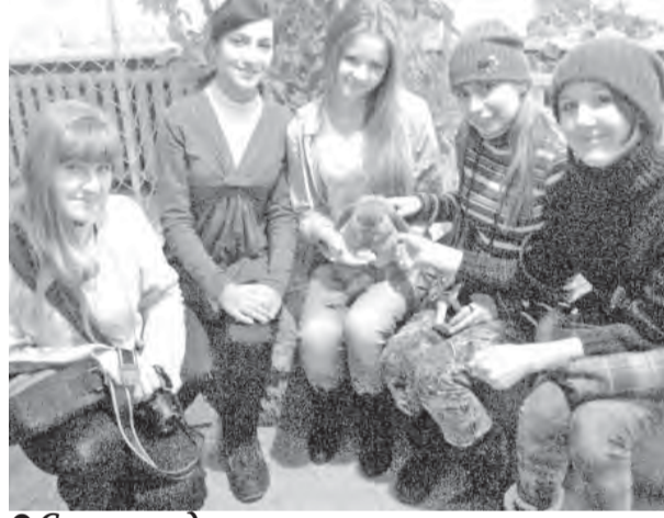
Символ года — кролик в наших руках.

грустно, я поспешила во второй зал — с рыбками и черепаками. Но здесь стояли всего три аквариума, в одном из которых зимовали лягушки.