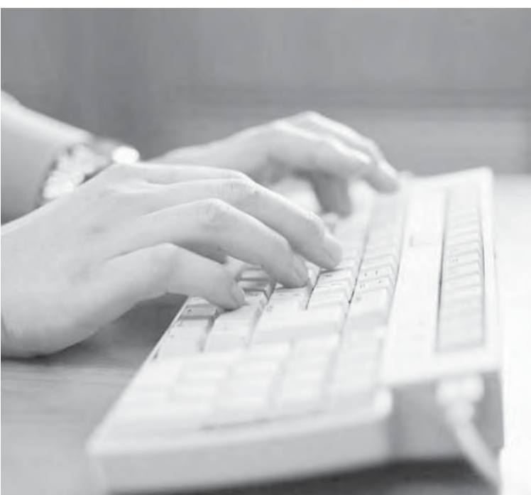
Выбор — на дистанции.

«Можно считать, что в течение восьми-десяти лет возможно создание системы удаленного электронного голосования на муниципальных выборах», — отметил Дмитрий Матюхин.