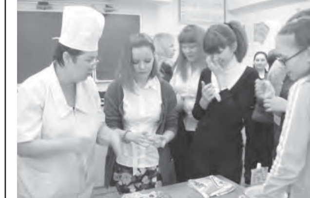
Класс «хлебных профессий».