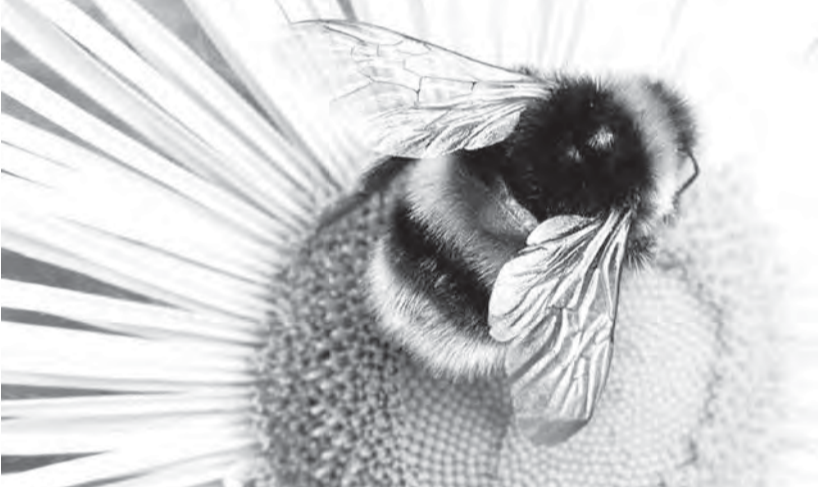
Пчелы - терапевты природы.

В январе 2011 года Продовольственная и сельскохозяйственная организация ООН (ФАО) сообщила, что мировые цены на продовольствие достигли исторического максимума с 1990 года.