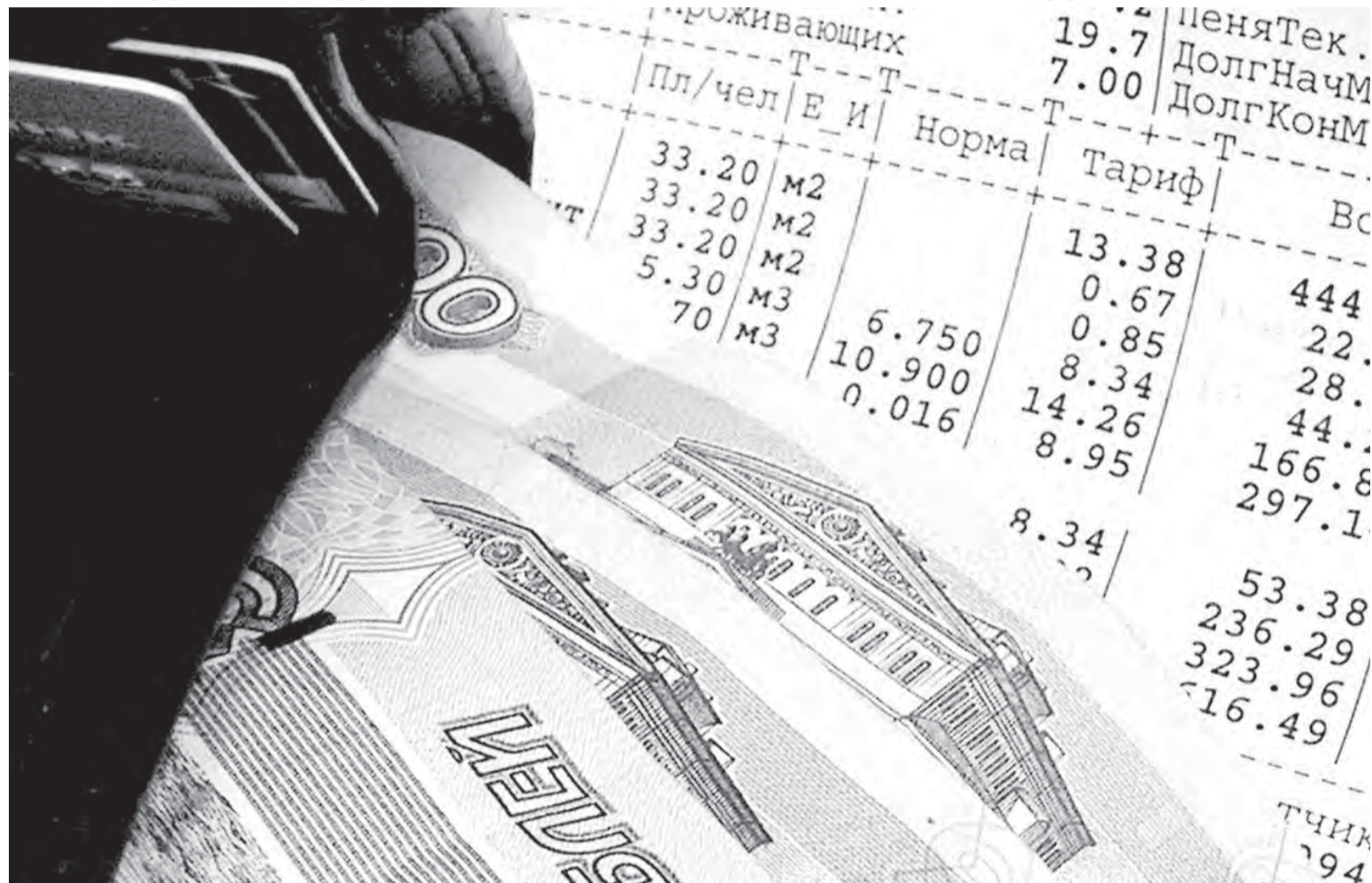
• Тарифы на коммуналку: все должно быть прозрачно.