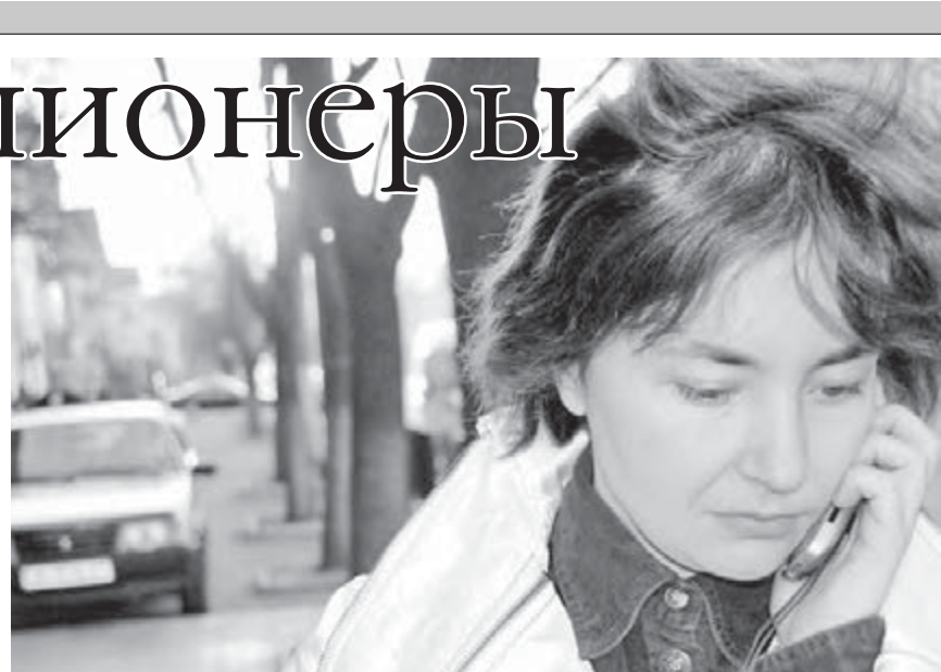
● От «мобильных» советов «как быстро похудеть» первым похудеет ваш кошелек...

Далее приводится подробный список самых популярных SMS-ловушек. Например, одна из наиболее эффективных по числу одураченных называется «Мама, украли телефон, положи деньги на этот номер». По свидетельству экспертов самым распространенным видом мошенничества с использованием мобильного телефона является примитивно наглое вымогательство. «Мама, я попал в аварию...», «Саша, сел аккумулятор...», «Лена, у меня неприятности...» – все подобные сообщения рассчитаны на то, что невнимательный абонент перечислит деньги на указанный номер мобильного телефона. Иногда во имя «спасения» родственника запрашивается довольно крупная сумма – до 15-20 тысяч долларов. Многие жертвы, находясь в состоянии аффекта от полученного известия, даже не задумываются о том, почему необходима сумма нужно предоставить в виде карт оплаты сотовой связи, а