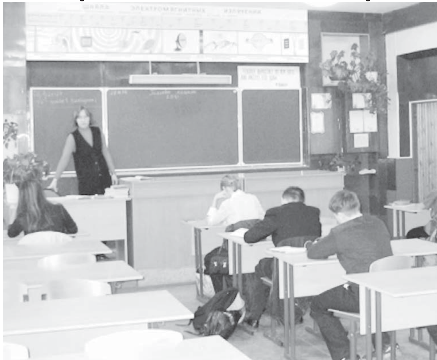
● С сегодняшнего дня школьники Магнитки переходят на дистанционное обучение.