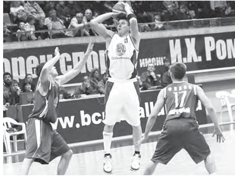
• В Пензе 1:1.

В первой игре хозяева выиграли нечетные четверти с разницей в 5 очков каждую (25:20 и 23:18), что и предопределило окончательный итог – 92:85. Магнитогорцы показали более высокий процент реализации двухочковых бросков (53 против 44), реализовали на два трехочковых больше, но проиграли подбор – 46 против 30.