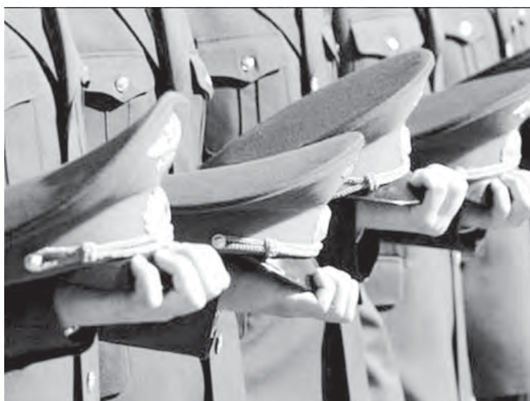
Реквием по милиции исполнила Госдума.

Госдума приняла в третьем, окончательном чтении закон, который возвращает службам по охране порядка и борьбе с преступностью название, появившееся при Петре Первом.