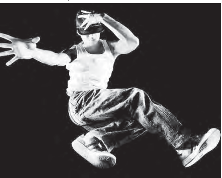
● Это уже акробатика!

вид битбоев напоминает персонажей Гарлема. А с другой – танцевать «уличный танец» совсем не просто. Нужно чувствовать ритм, отлично владеть своим телом, быть гибким и пластичным и, конечно же, иметь свой индивидуальный стиль. То есть, чтобы стать победителем, физическую подготовку здесь нужно иметь не малую. Кроме того, данная молодежная культура призвана приобщать молодежь к проведению досуга на спортивных площадках. И, как сказала мама одного из участников – «Пусть хоть так, лишь бы не шлелись и не хулиганили».