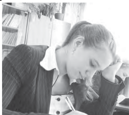
● Так учиться не годится.

Интегрированный курс дает минимальные знания и направлен на «социализацию учащихся», базовый курс обучает «основам»,