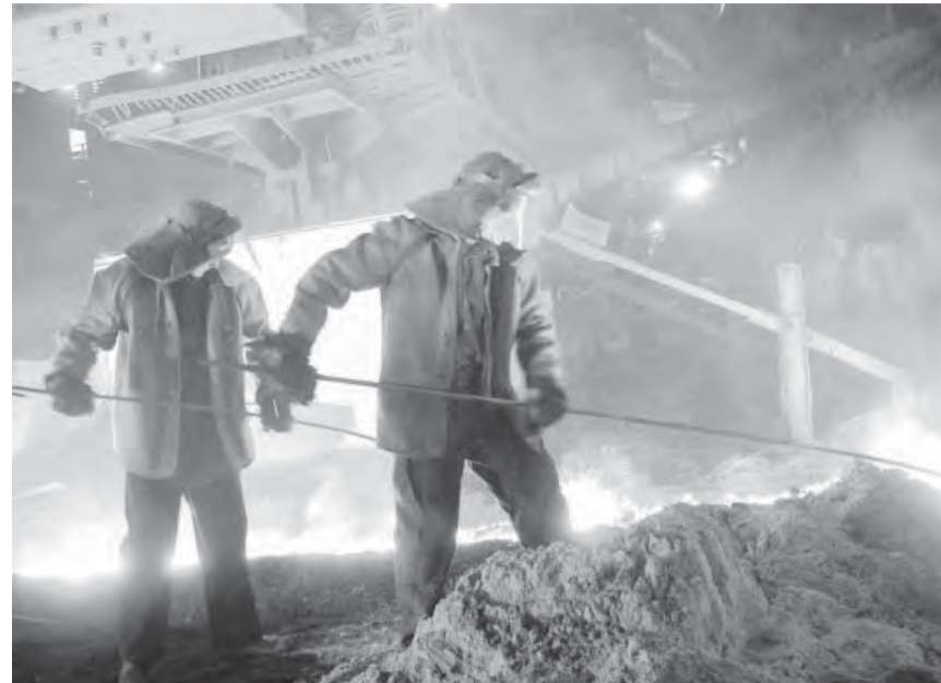
● У домы жарко всегда.