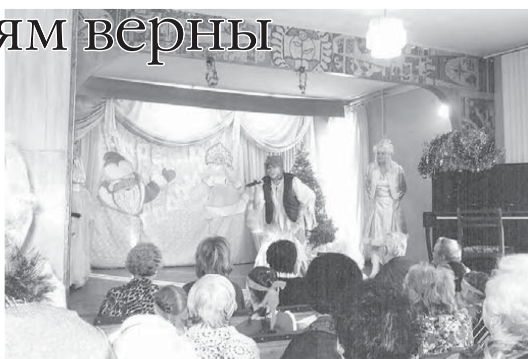
● Сцена из новогоднего спектакля.