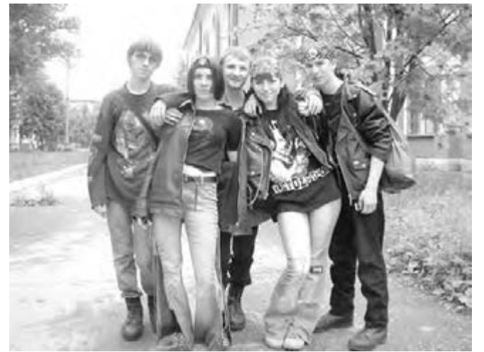
● Авторитетом для молодежи пока остается только сама молодежь...

«Принудительное тестирование – мера явно незаконная.