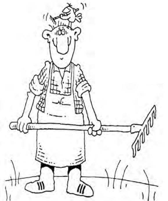
Рисунок Игоря КИЙКО

27, 28 ФЕВРАЛЯ – работы с декоративно-лиственными растениями.