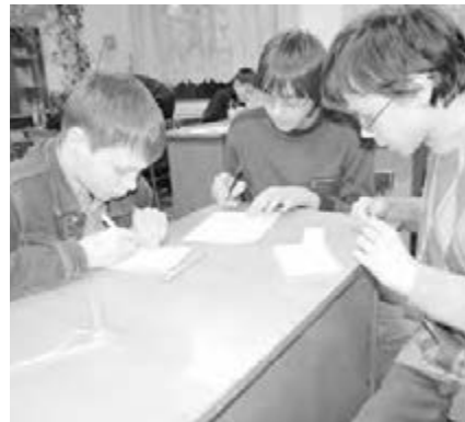
● Решать задачи сложные не каждому дано.

Основные задачи, которые ставят перед собой педагоги – организаторы состязаний, – активизировать индивидуально-групповые формы работы с учащимися, направленные на развитие их интеллектуальных и творческих способностей, подготовка ребят к участию в турнирах регионального и всероссийского уровня.