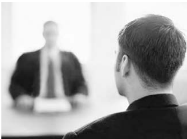
● Бизнес будет экономить на работниках.

С 1 января отчисления в фонды – пенсионный, медицинского и социального страхования – увеличены до 34 процентов. А это вполне может вылиться в то, что предприниматели вернутся к практике выплаты зарплат «в конвертах» (по данным Росстата, доля таких выплат сейчас составляет всего 12 процентов). Эта практика может подхлестнуть рост