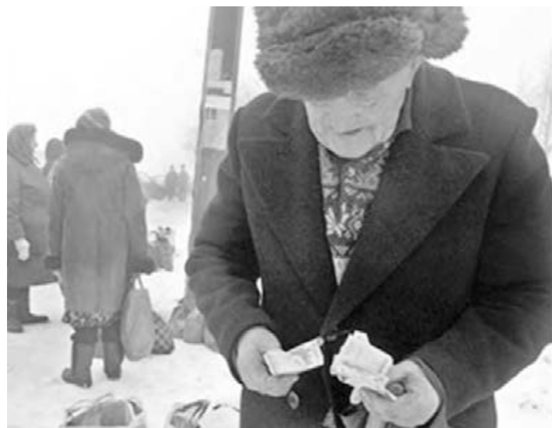
● Думайте сами, решайте сами.

Пример третий. Гражданин Н. в 2010 году подал заявление о возоб-