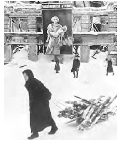
● Ленинград, зима 1941-го.