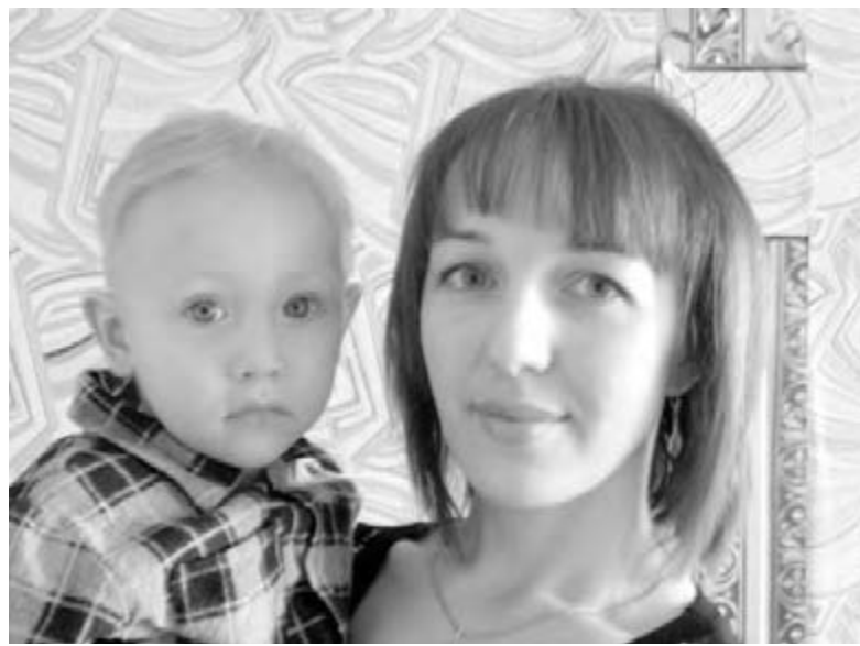
● А глаза-то мамы...

– Все что я делаю в жизни, идет на благо моей семьи. Я поставила цель получить второе высшее образование и очень счастлива, что