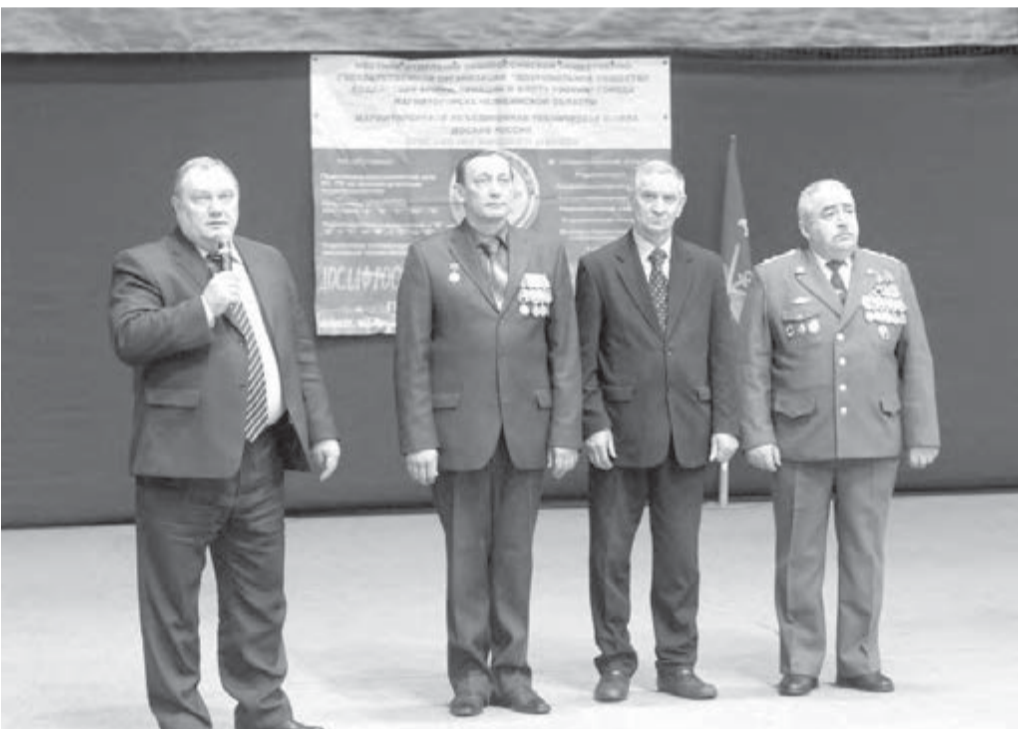
● Собравшихся тепло приветствовали высокие гости.

Произвело впечатление на присутствующих выступление центра служебного собаководства ДОСААФ и клуба служебной дрессировки. Такого повиновения хозяину редко встретишь. А когда немецкие овчарки «задержали» нарушителя, зал разразился аплодисментами.