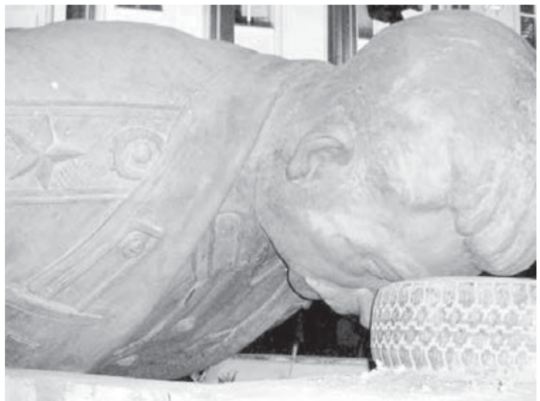
● Коба не знал, что его выставляют на продажу...

На Южном Урале нашли похищенного Сталина. С вождя взяли «подписку о невъезде».