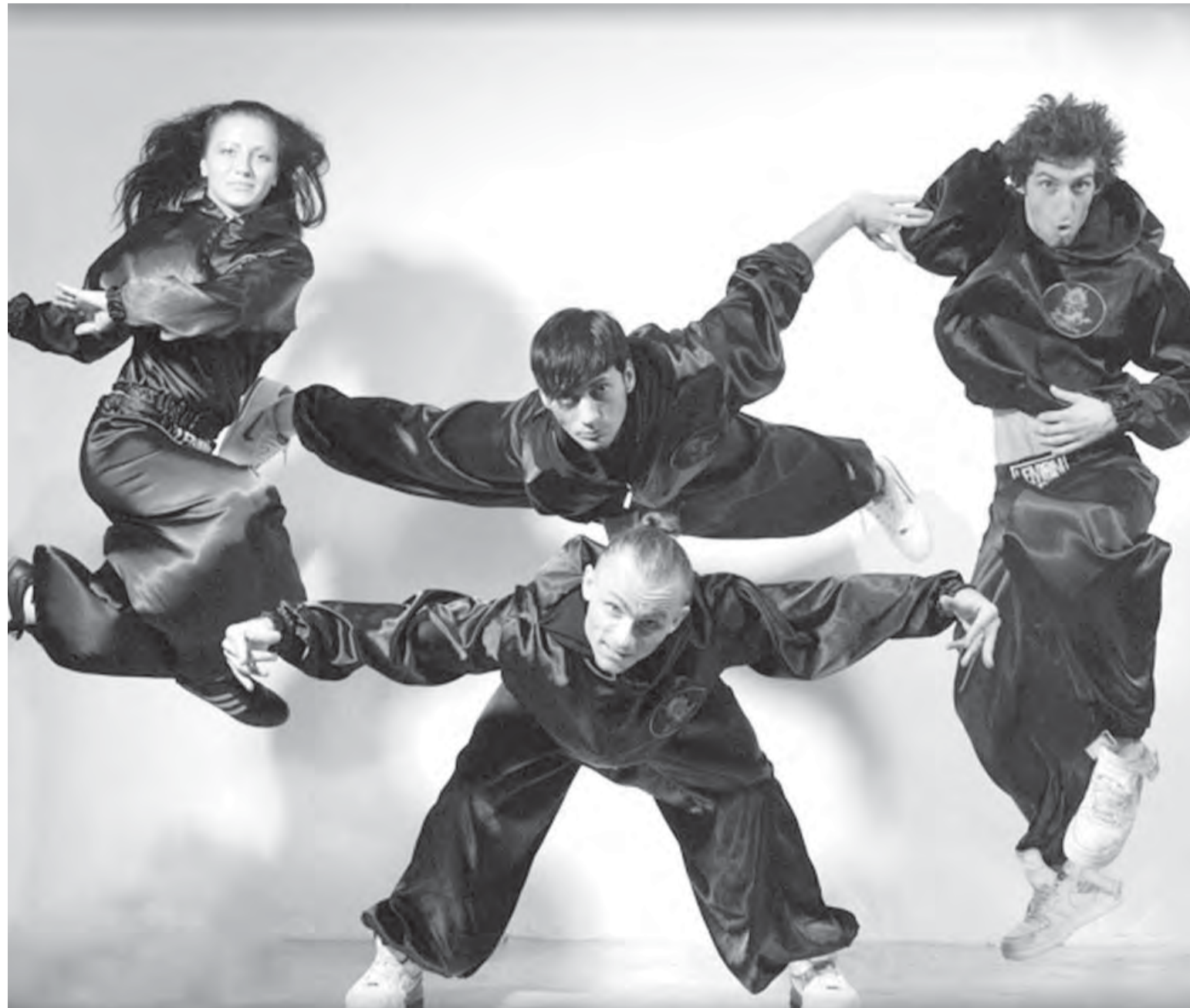
● На фестивале уличной культуры чего только не увидишь!