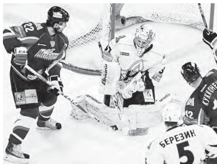
• «Металлург» - «Нефтехимик»: момент встречи.