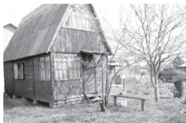
● Мой дом — моя крепость — это не для наших садов.