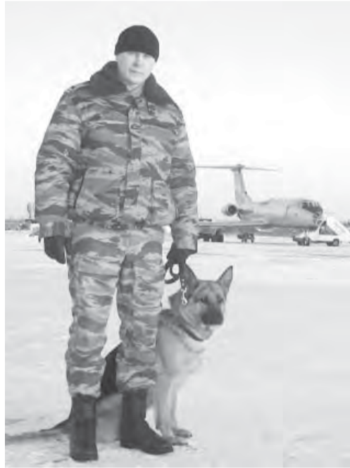
● Учуять врага.

Также добавили, что все сотрудники ориентированы на обнаружение предметов, которые могут содержать взрывчатые вещества, и проинструктированы о необходимых действиях в этом случае. Кроме того, по сведениям линейного отделения милиции на станции Магнитогорск, усилены меры безопасности на транспортных предприятиях, при проверке ручной клади и досмотра пассажиров, максимально задействована кинематическая служба. Представители милиции на транспорте обращаются к пассажирам с просьбой внимательно относиться к подозрительным предметам и оставленным без присмотра вещам. Если некая коробка или ручная кладь подозрительно выглядит, долгое время остается без присмотра, обратите на это внимание сотрудников милиции