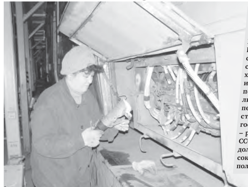
● У безработицы в Магнитке женское лицо.

— Ныне молодежь ориентирована на получение высшего, на крайний случай, в составе университетского комплекса, на получение среднего профессионального образования. Что же произойдет с начальным