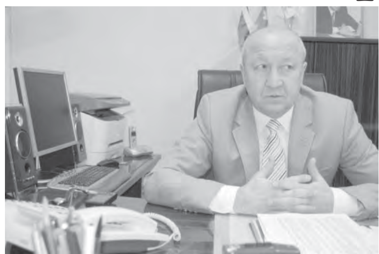
● На «горячей линии» ректор МГУ.