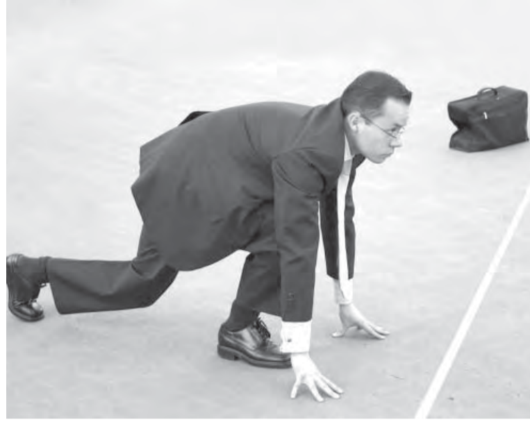
● В бизнес – с низкого старта.