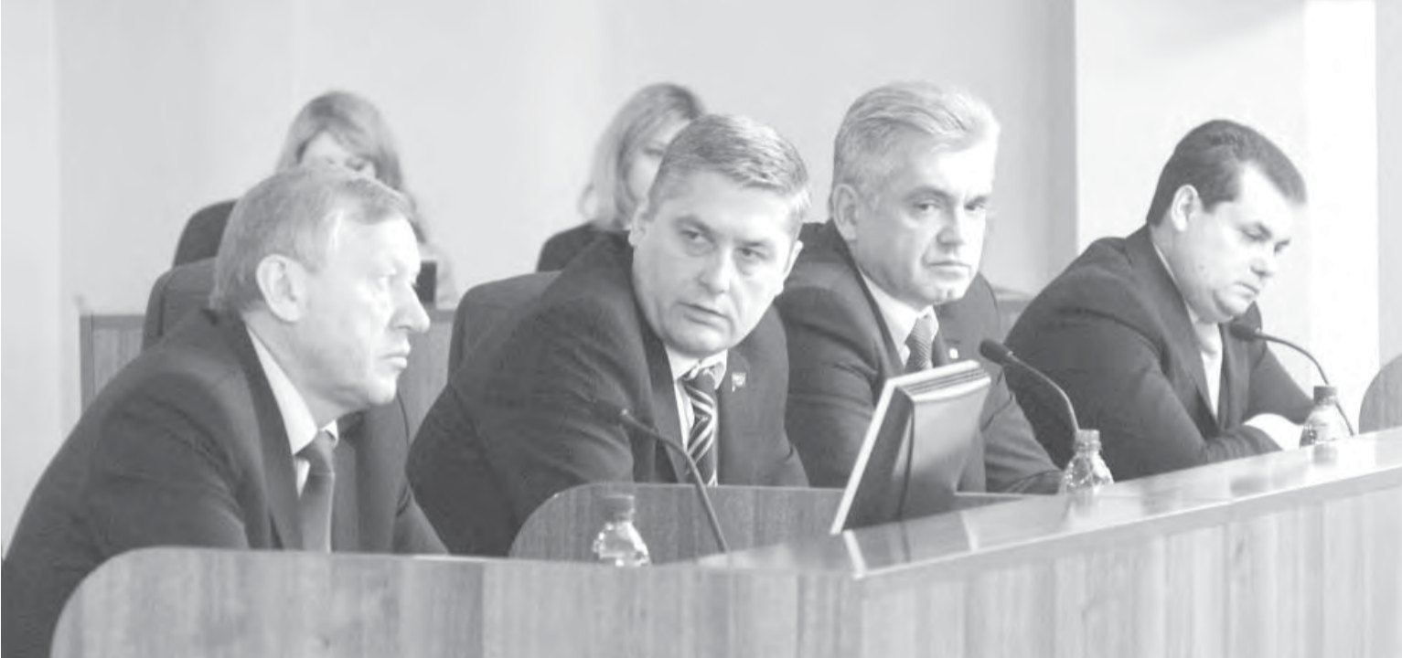
• На вчерашнем заседании горсовета рассмотрены важные для города вопросы.