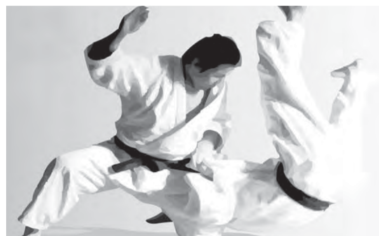
• Иппон – чистая победа!

первенства Магнитогорска среди юношей 1999-2001 годов рождения, ребята, представляющие клубы «Белый тигр», «Цунами» и «Юность».