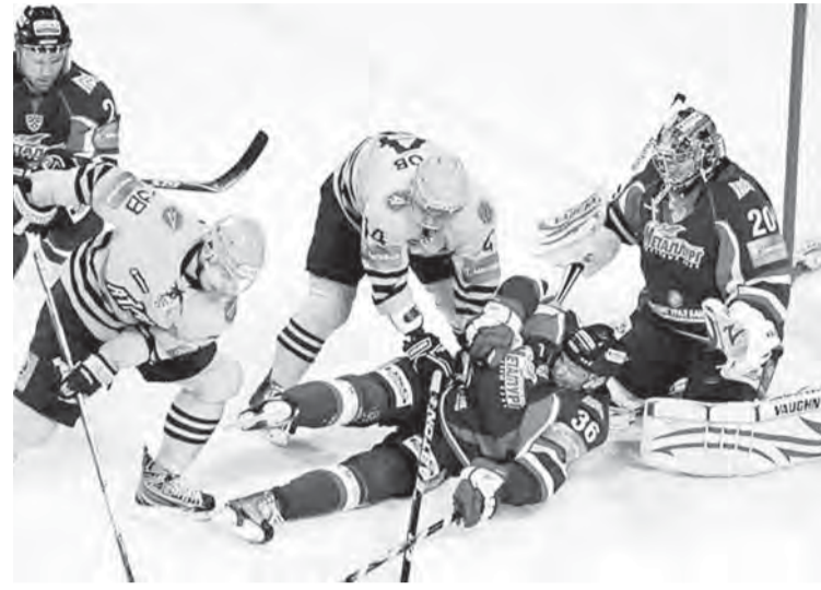
«Атлант» оказался для «Металлурга» крепким орешком.

«Металлург» потерпел второе домашнее поражение подряд, уступив в серии буллитов «Атланту» - 2:3. Магнитогорцы проигрвали уже в девятый раз в нынешнем сезоне в родных стенах, установив своеобразный антирекорд.