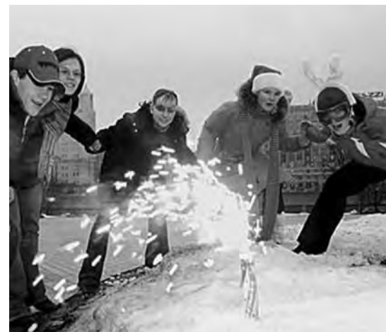
● Зажигай на празднике с умом.

Отдельно вопросами безопасности займутся в ночных клубах. «В этих заведениях используется пиротехника, находится большое количество легковоспламеняющихся жидкостей, затруднены экстренные пути вывода посетителей. В вопросах безопасности нельзя допускать либерализма. Я не призываю к карательным мерам, но если есть нарушения, они должны быть устранены», – подчеркнул глава МЧС России Сергей Шойгу. В 2011 году из-за нарушений правил эксплуатации пиротехники возникло 63 пожара, в 2010 году их было в два раза больше – 133. Несмотря на положительную динамику, сотрудники