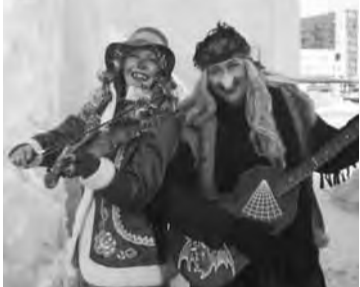
•Задорные Бабки Ежек из Дома музыки.

В этом году их было много. Участвовать в конкурсе, объявленном накануне праздника на лучшего новогоднего деда, выдвигались самые веселые и кре-