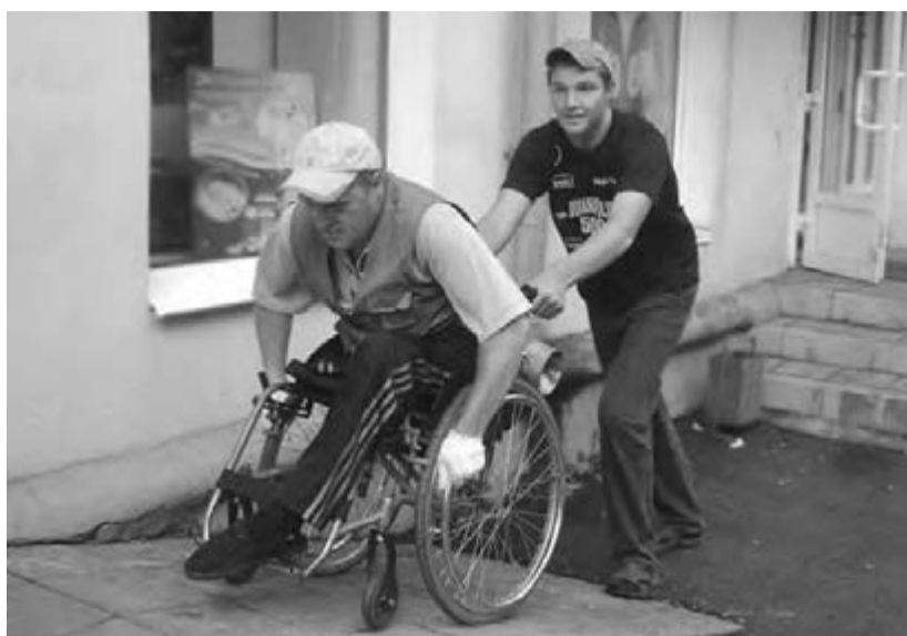
● Впервые за многие годы министерству удалось обеспечить инвалидов колясками...

менений произошел в сфере социального обслуживания населения. Сегодня на базе многих центров комплексного обслуживания населения начали работать школы реабилитации и ухода за людьми с ограниченными возможностями. До конца будущего года они откроются во всех центрах.