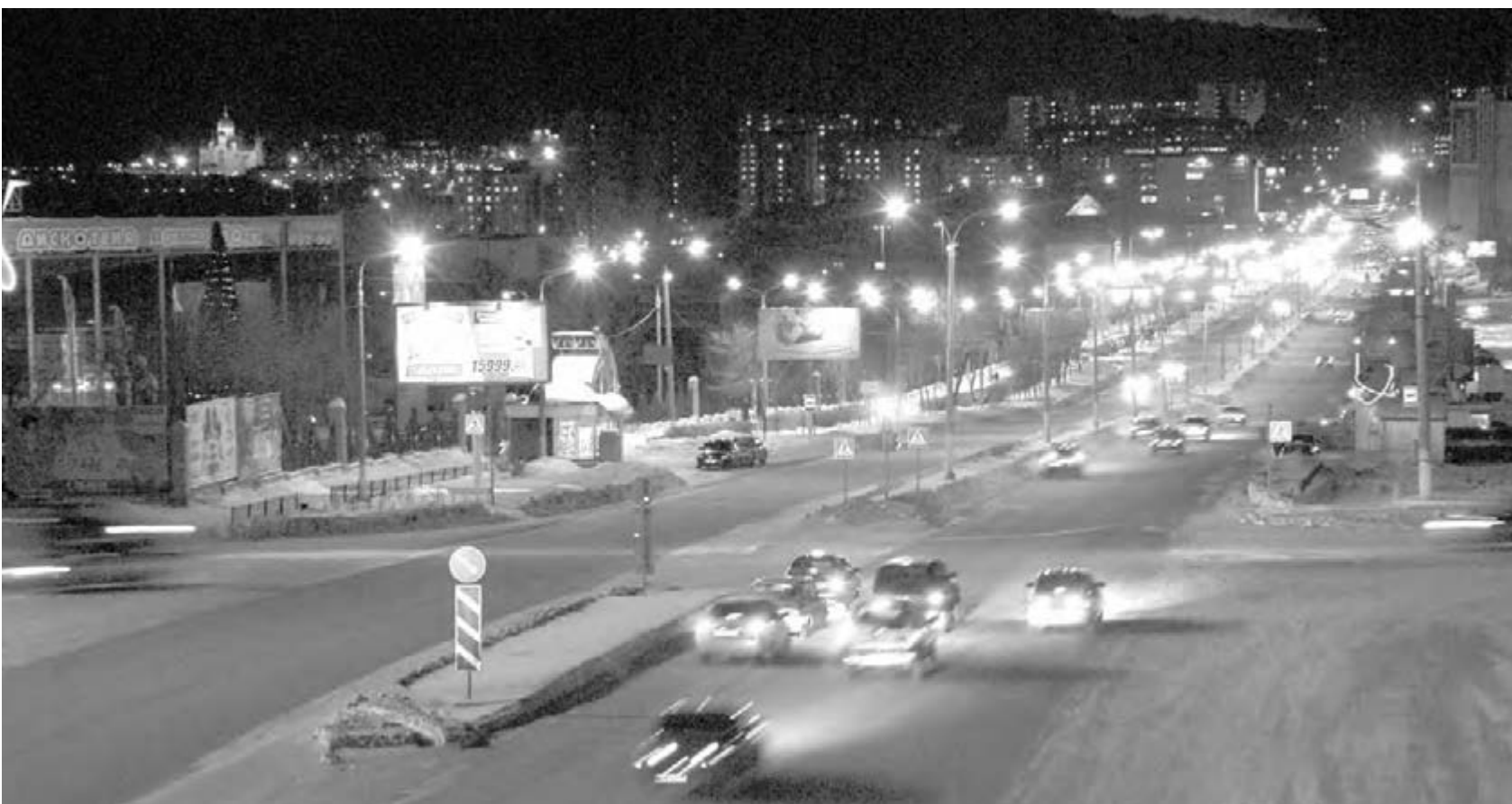
● Наш Магнитогорск признали одним из десяти самых освещенных городов страны.