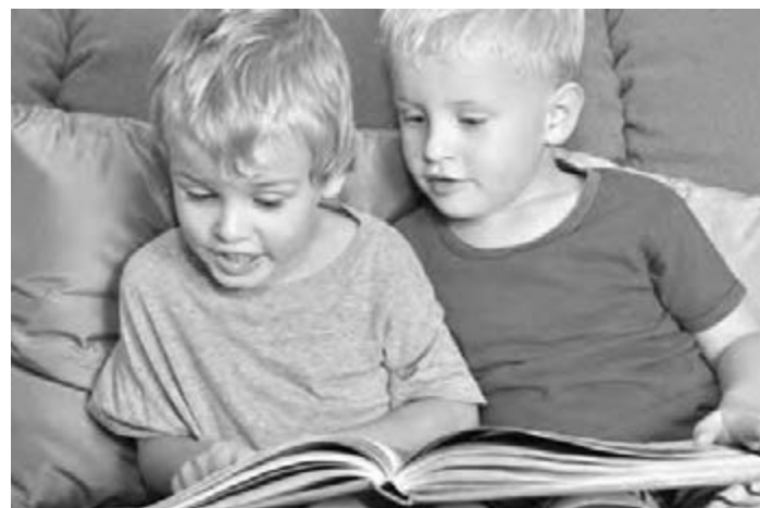
● Любовь к чтению нужно прививать с малолетства.

Российское образование решило спасти через художественное чтение.