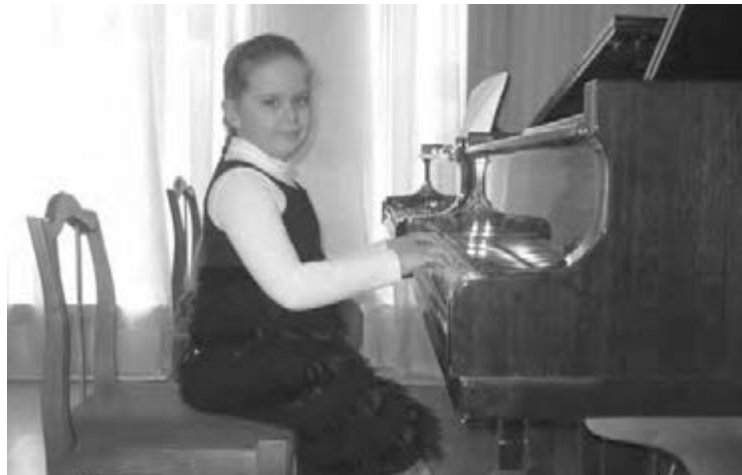
• Юлю высоко оценили профессионалы.