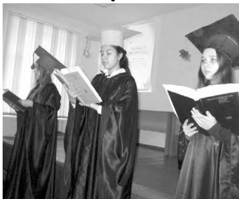
● На одном из этапов конкурса.

Организаторами марафона выступили управление образования администрации города, МаГУ и Дворец творчества детей и молодежи. В марафоне приняли участие старшеклассники двадцати школ города. Для четырех педагогов образовательных учреждений, посетивших вместе с детьми все площадки марафона, это был мастер-класс по пяти направлениям деятельности Дворца. Студенты МаГУ, члены научного студенческого общества, стали кураторами команд, в которые объединились все участники марафона. Команды прошли по пяти интеллектуально-творческим площадкам в соответствии с теми областями наук и знаний,