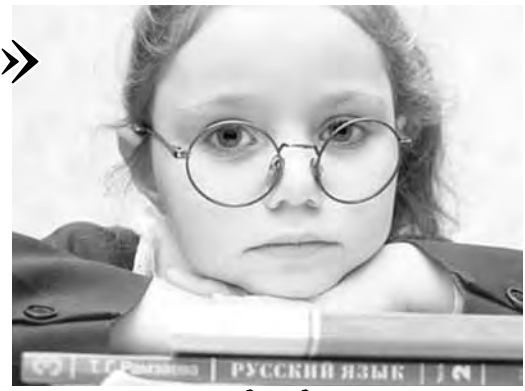
● Чем умнее сегодня дети, тем «круче» для них конкурсы.

«Интелло» проводится в четырех возрастных группах, соответствующих 8-м, 9-м, 10-м и 11-м классам. По результатам участия в каждом этапе начисляются баллы, которые суммируются в личном зачете участника марафона. Абсолютные победители определяются