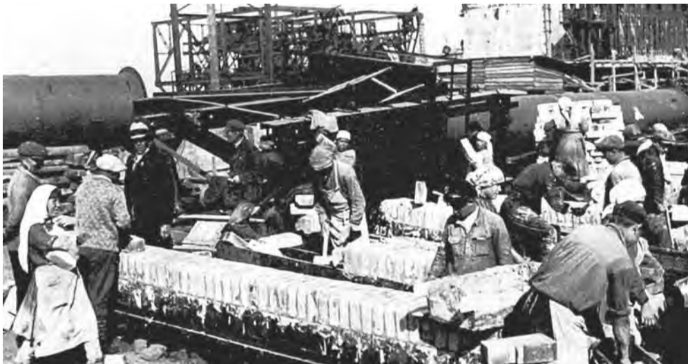
• На кладке восьмой коксовой батареи.

//Геннадий ПОГОРЕЛЬЦЕВ Фото из архива автора