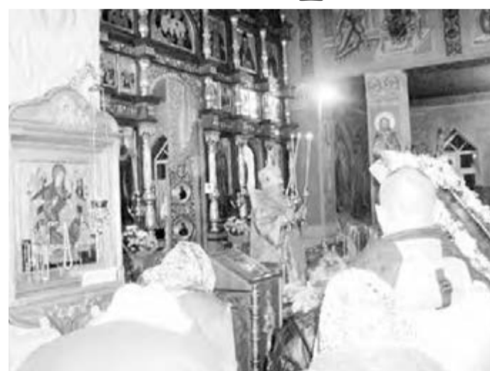
• Во время храмовой службы.

В Магнитогорске православный храм во имя святого Николая Чудотворца (проект архитектора М. Н. Дудина) открылся в 1947 году в поселке Дзержинского. Большую помощь в его строительстве оказал директор ММК Г.И. Носов. В 1961 году церковь была закрыта, в здании размещали планетарий, склад, а в 1990