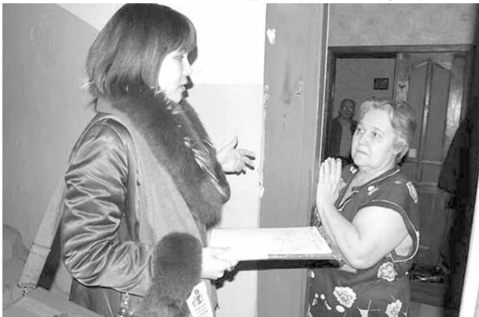
● Переписчики в 2010 году заходили в каждый дом. Окончательные результаты стали известны сейчас.