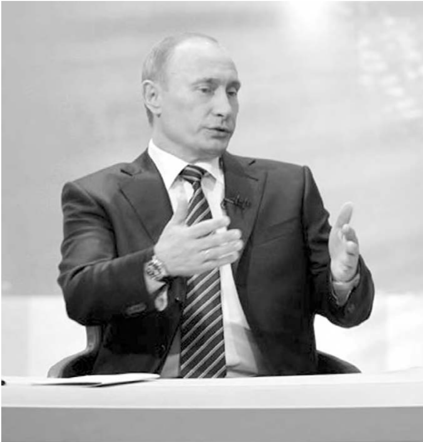
● Встреча с Владимиром Путиным продолжалась более четырех часов...