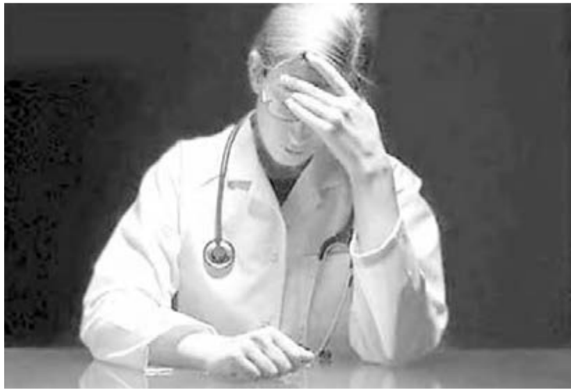
● Если прибавили, так уж не отнимайте!

Тариф фонда рассчитан на финансирование пяти статей расходов: заработная плата, начисления на нее, питание, медикаменты и мягкий инвентарь. Для нормального функционирования больницы ей необходим двух-трехмесячный запас всех необходимых медикаментов и расходных материалов. На сегодняшний день эти запасы в больницах в среднем рассчитаны на полгода и более.