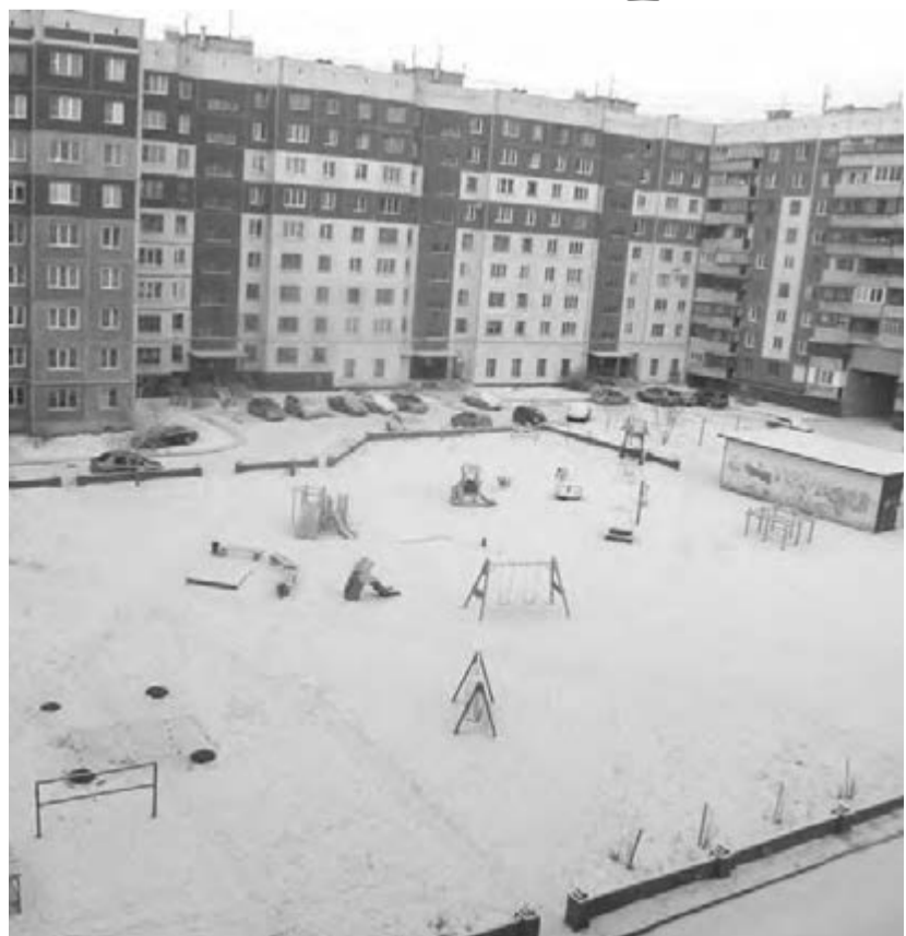
● Двор – пространство для комфортной жизни.

Кроме того в письме уточняется, что по внутридворовым проездам не должно быть транзитного движения транспорта. То есть дворы нельзя использовать для объезда и проезда автомобилей. У нас, к сожалению, такое тоже случается. По крайней мере, так было, когда летом ремонтировался участок дороги на пересечении улиц Гагарина и Суворова. Маршрутки и прочие автомобили вместо того, чтобы