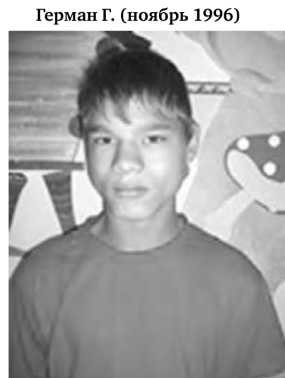
Герман Г. (ноябрь 1996)

Продолжаем публикацию сведений о детях-сиротах и детях, оставшихся без попечения родителей. Каждое из этих маленьких сердец надеется найти свой собственный дом и любящую семью.