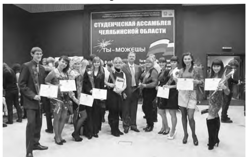
● «Молодежный ноябрь» выявил лучших.

Все было условно поделено на два направления. Конкурс «Ты лучший!» проходил так: на заочном туре экспертным советом рассматривались заявки всех студентов, из которых выбирали три кандидатуры по соответствующим номинациям, а на очном туре определяли победителей. И была номинация «Мы лучшие», где основной задачей участвующих в командном конкурсе стало последовательное прохождение игры,