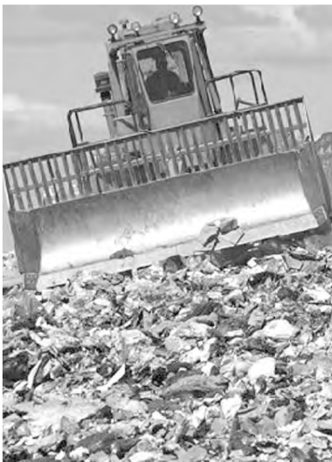
● Что делать с мусором?

Южноуральцам придется сортировать свой мусор. Во что экологи Челябинской области планируют превращать отходы?