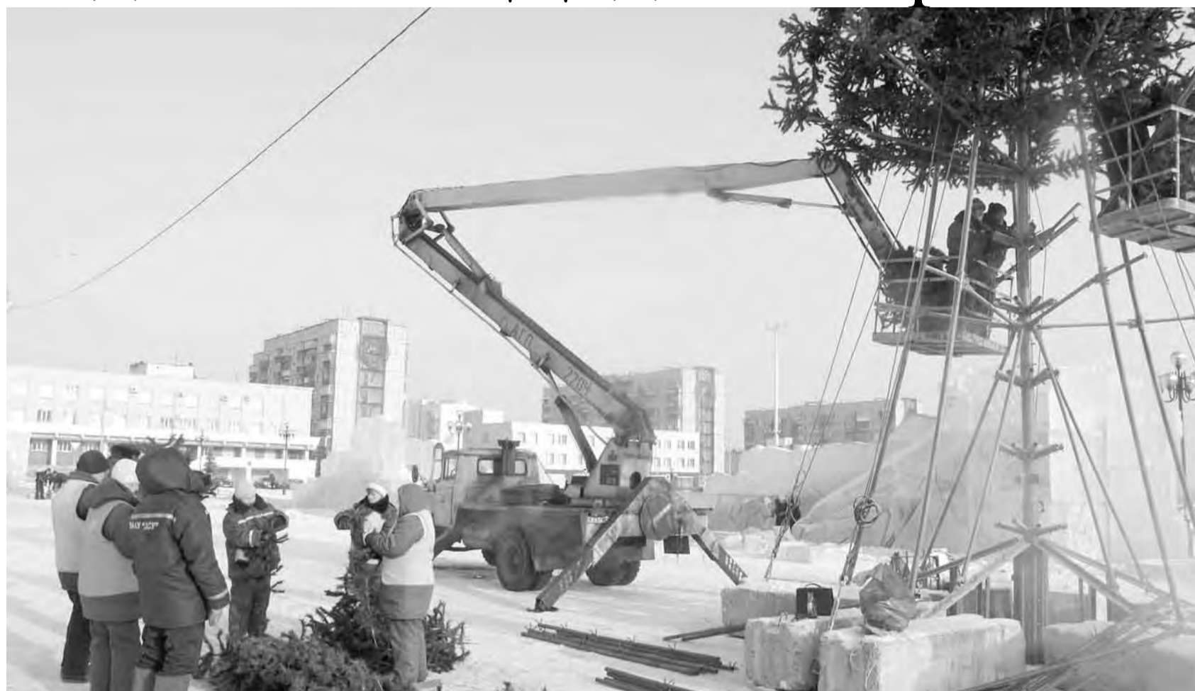
• У курантов заканчивают обустройство главной городской елки.