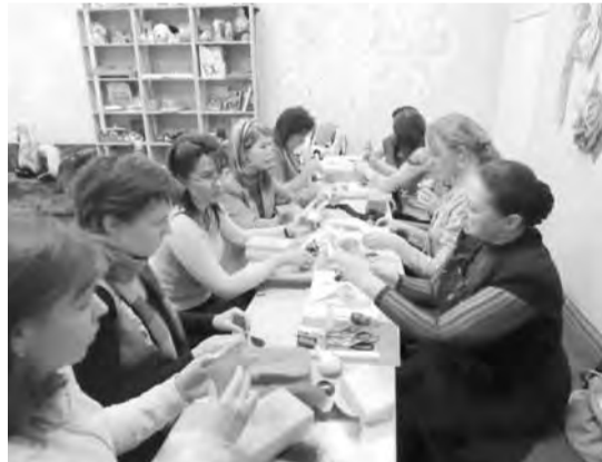
● Своими руками.