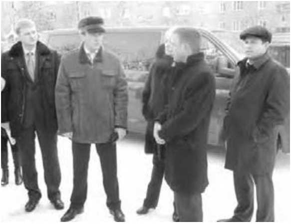
В ходе объезда.