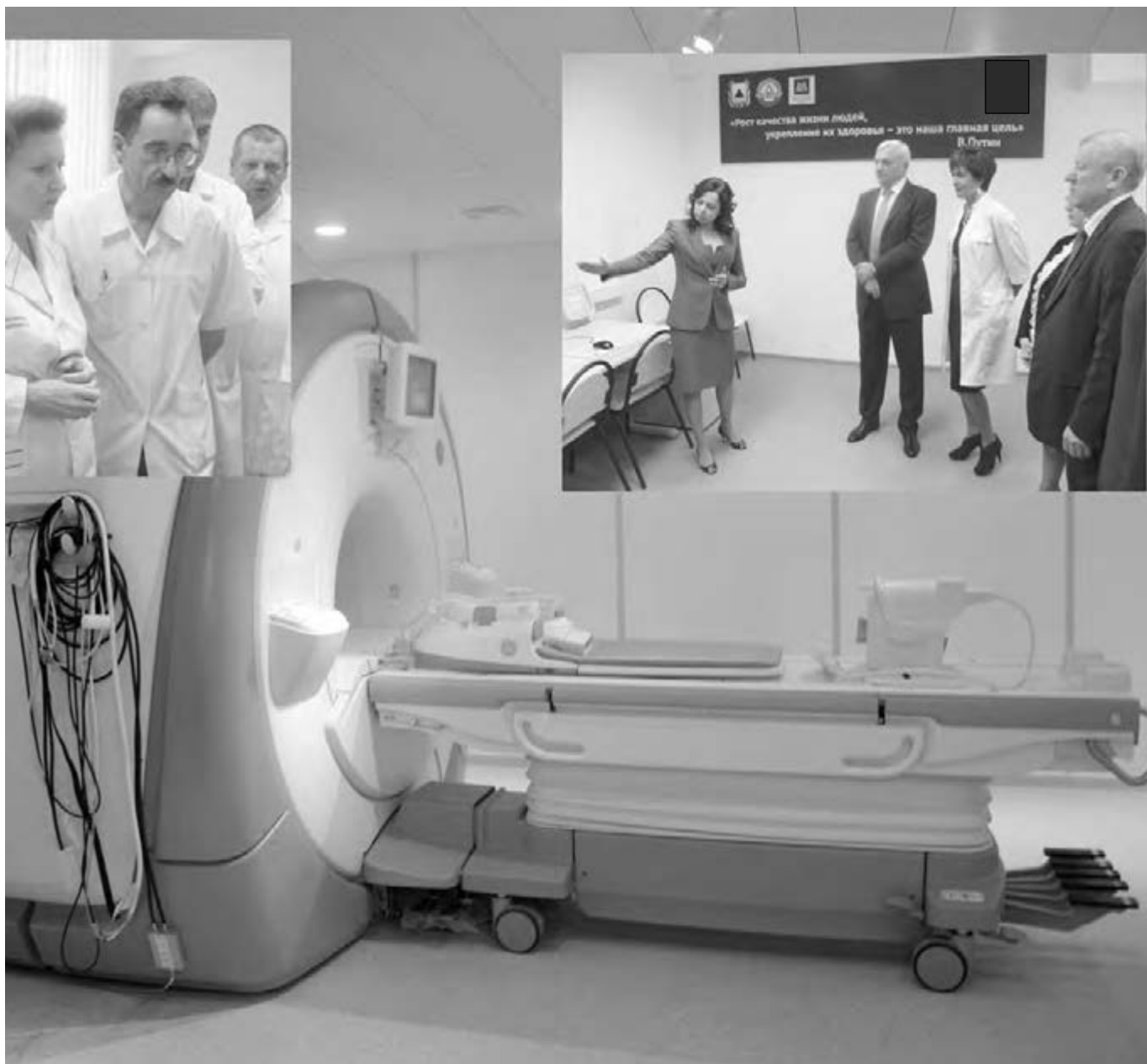
● Новый томограф получил при приемке резонное сравнение со «звездными» технологиями.