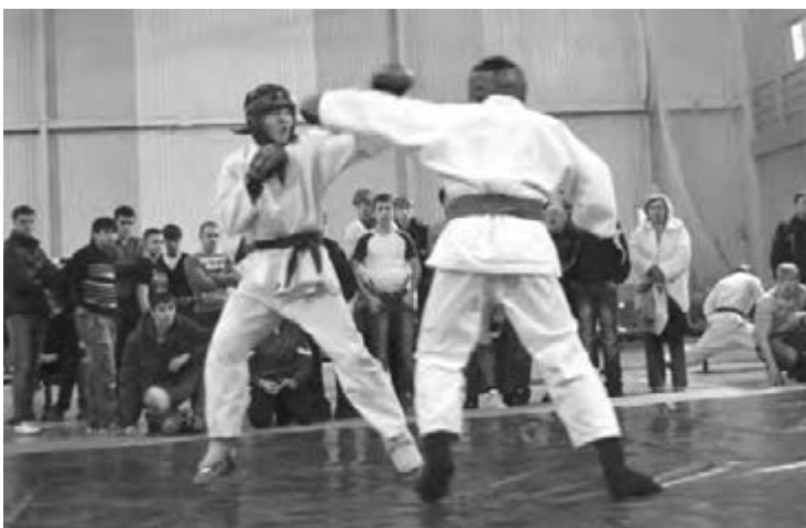
● Боевой контакт.

В состязаниях участвовали юноши трех возрастных групп: 12-13, 14-15 и 16-17 лет, каждая из которых была разбита на восемь весовых категорий. В течение двух дней на ковер вышли около 70 спортсменов из семи организаций области. Магнитогорск представляли четыре клуба: «Кристалл», «Джиу-Джитсу», «Черный дракон» и «Тайский бокс».