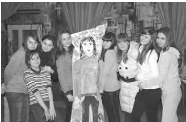
Быть в команде и сохранять лидерскую позицию - непросто.

Лидерство предполагает наличие организаторских способностей и коммуникативных навыков. Этим качествам подростков тоже нужно обучать.