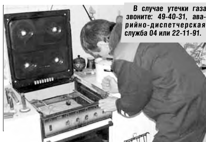
В случае утечки газа звоните: 49-40-31, аварийно-диспетчерская служба 04 или 22-11-91.