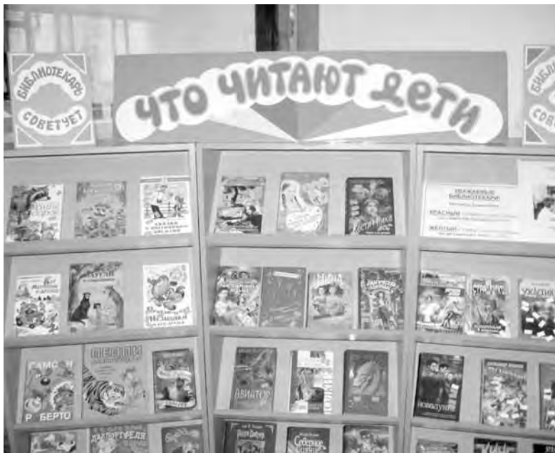
● Самые читаемые магнитогорскими детьми книги.

В сентябре в Центральной детской библиотеке им. Н. Г. Кондратовской начала работу «Школа радостного чтения», в рамках которой проводятся громкие чтения, уроки этики, обсуждения книг, ставятся спектакли по прочитанным книгам. В детской библиотечной системе города каждый год проходит около двух тысяч массовых мероприятий по продвижению книги. Почти все они сопровождаются компьютерными презентациями – электронно-иллюстрированными приложениями. Ежегодно библиографическим отделом издается от