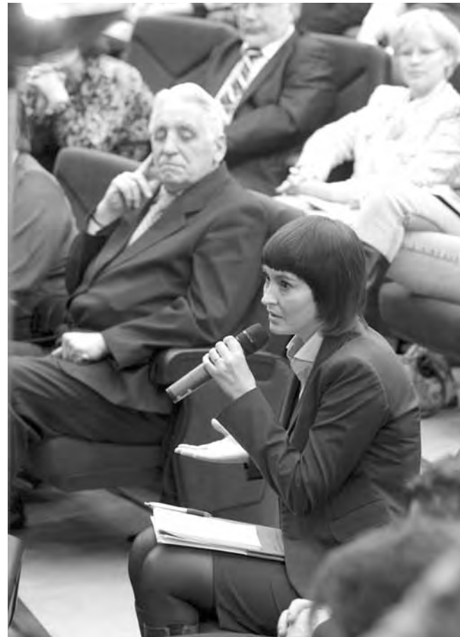
● О том, что наиболее важно.

Рассказывая о ходе отопительного сезона, губернатор остановился на планах