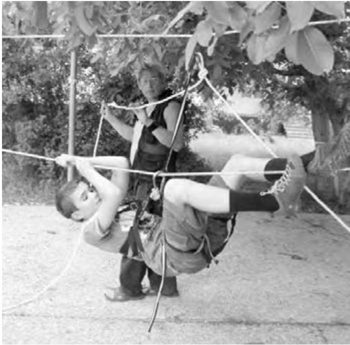
● Навесная переправа.