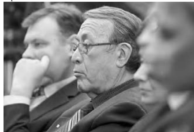
● Главу региона слушали с не ослабевающим вниманием.