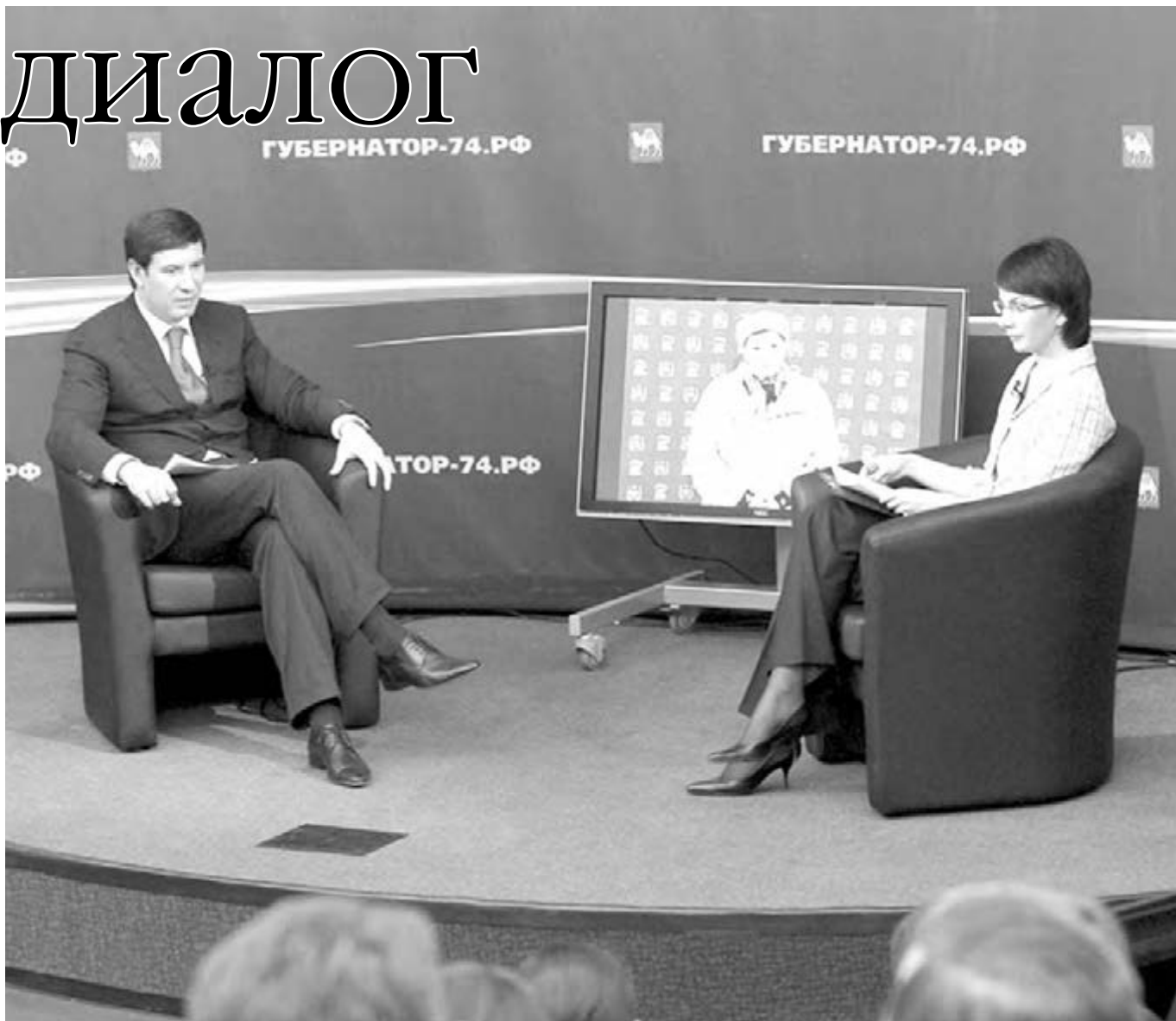
● В мобильной студии во время «Диалога с губернатором».