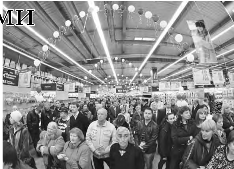
Новый торговый центр – пример крупнейших инвестиций в городе.

С начала своей работы на российском рынке компания придерживается стратегии, основанной на тесном сотрудничестве с местными сельскохозяйственными производителями и поставщиками.