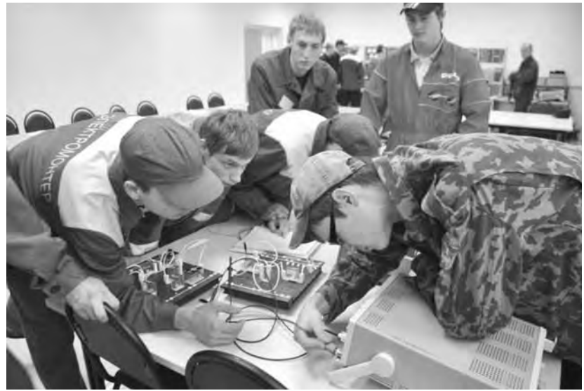
● Не каждому дано с электрооборудованием быть на «ты».

Свои знания участники соревнований проверили по таким дисциплинам, как «Электротехника», «Техническое обслуживание и ремонт электрооборудования», «Материаловедение», «Экономика отрасли и предприятия». Членами жюри был отмечен высокий