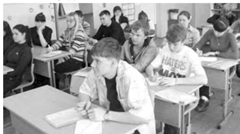
● За партией – молодые активисты.

В первый день приезда участники получили домашнее задание – разработать проект социально значимого мероприятия. А чтобы было от чего оттолкнуться, первую половину дня посвятили обучению. На мастер-классе кандидата педагогических наук и заместителя декана по воспитательной работе