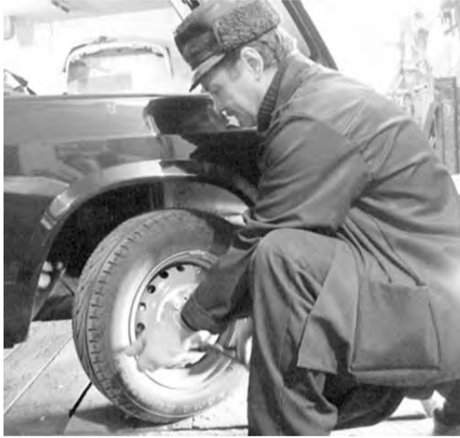
● Первое дело – сменить летние шины.

Зимой в бачок омывателя необходимо заливать не воду, а специальную омывающую жидкость. Она не замерзает на морозе, удаляет со стекла и щеток стеклоочистителя грязе-