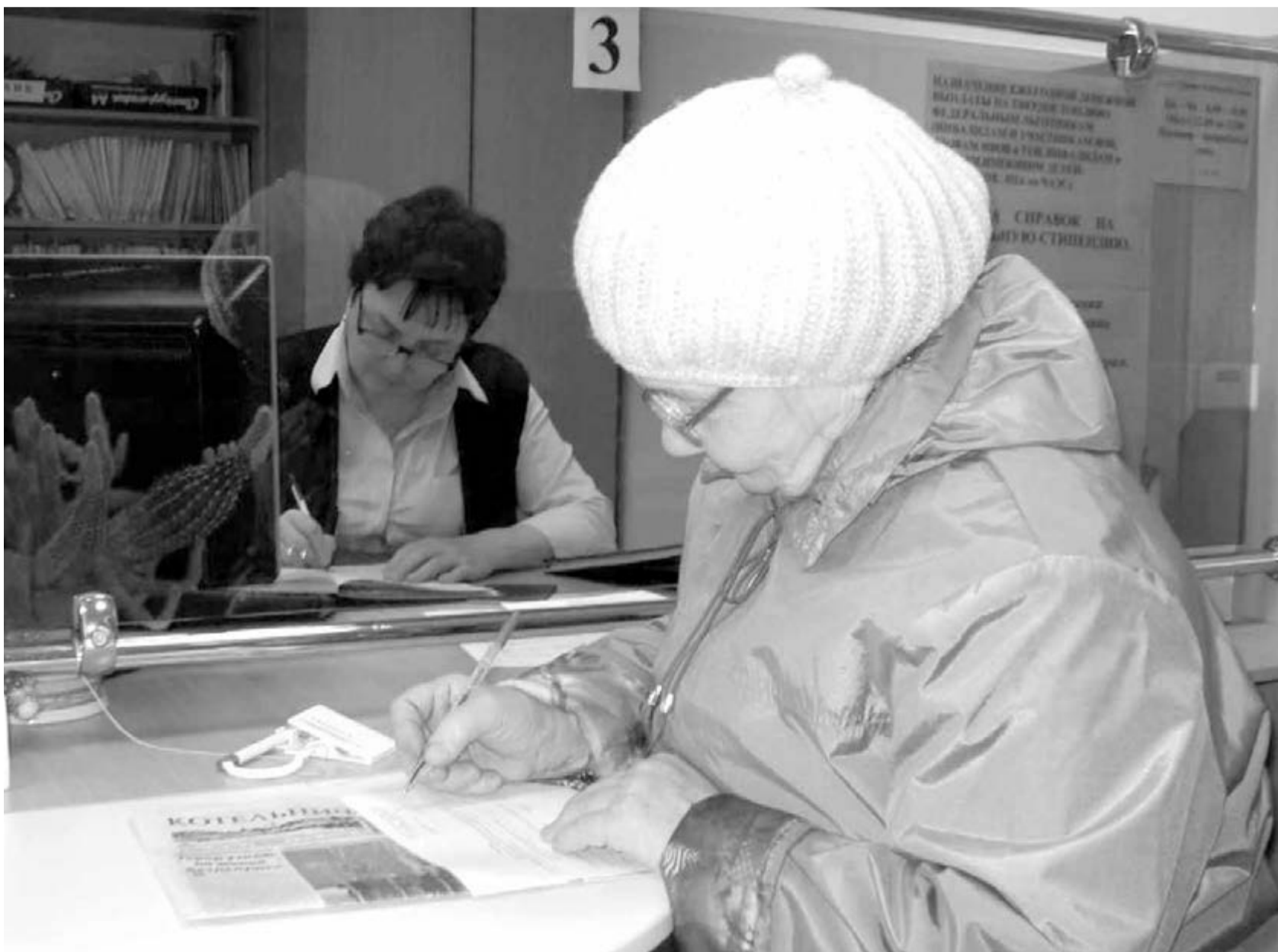
● Механизм начисления «живых денег» льготникам в виде компенсаций изменен.