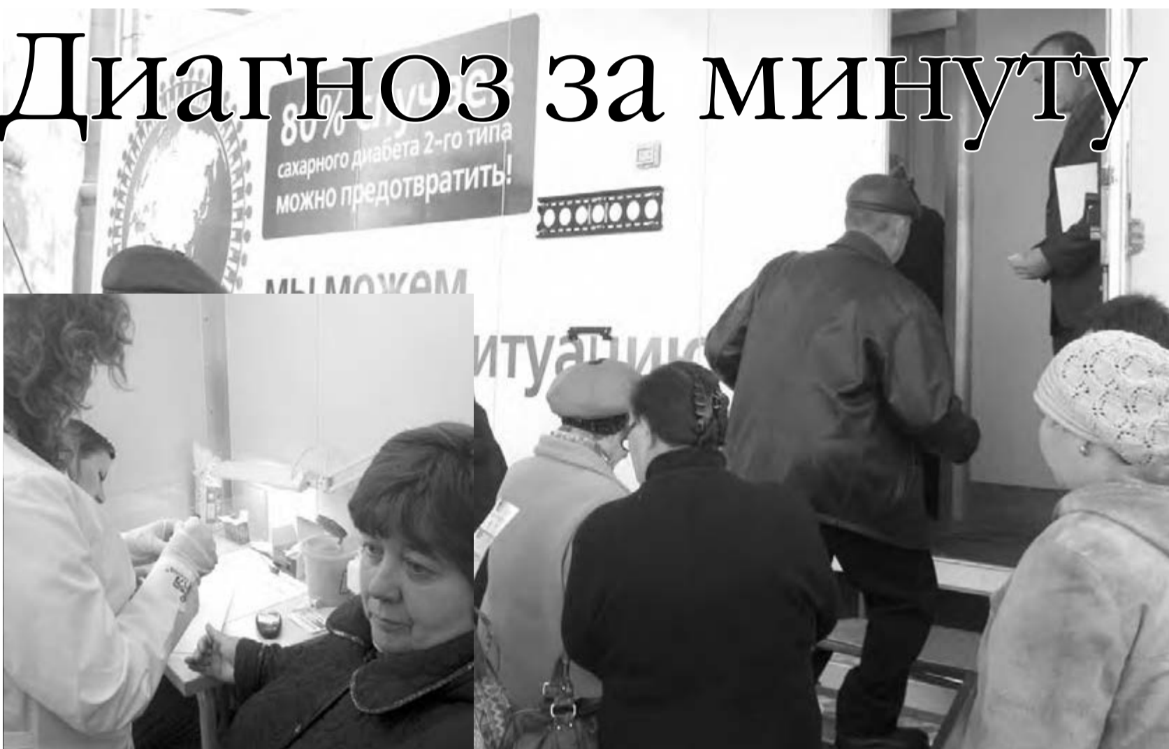
● Определить, в норме ли уровень сахара в крови, можно за минуту.