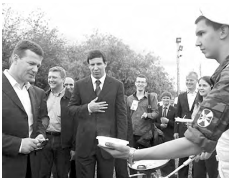
● Губернатор отдал молодежной каше...

Челябинская область поделится опытом организации молодежных форумов на заседании Госдумы РФ.