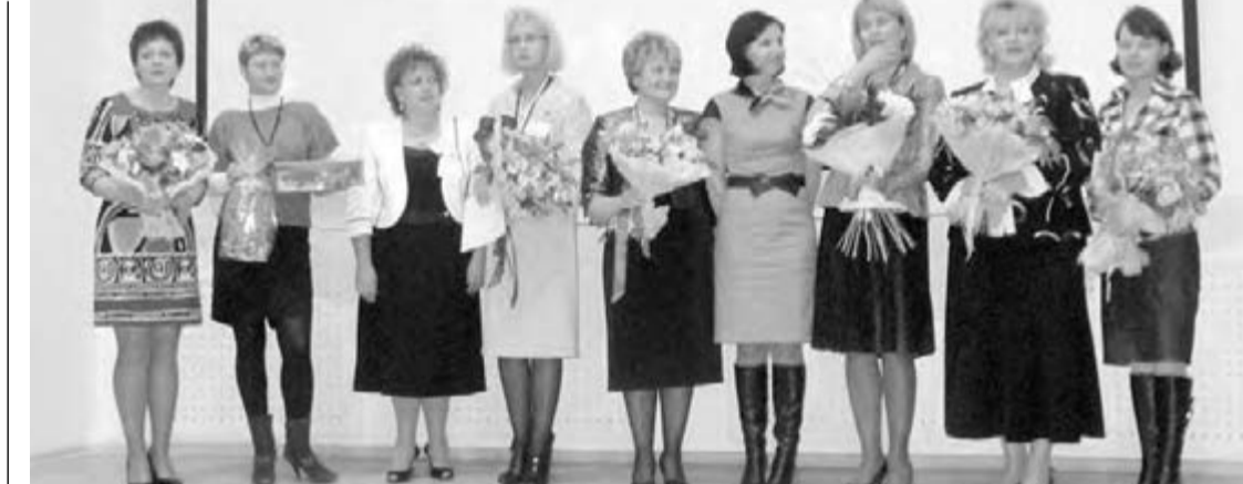
● Каждая из финалисток была достойна победы.

Между этапами конкурса баллы для своих участниц зарабатывали и болельщики, приехавшие поддержать честь города или района. Лозунги и плакаты, дружные аплодисменты и речевки разряжали обстановку. И