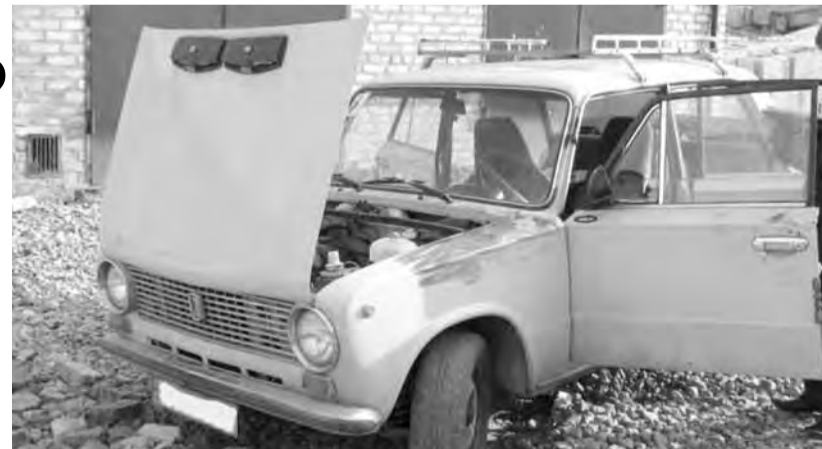
● Чаще всего угнанные автомобили разбирают на запчасти, считают оперативники.

8 октября статистика «пропаж» опять пополнилась. На этот раз владельцы лишились не дорогих иномарок и внедорожников, а, казалось, совсем неприметных автомобилей отечественного производства. Преступники не прошли и мимо «маршрутки». Таким образом, в ночное время было угнано сразу