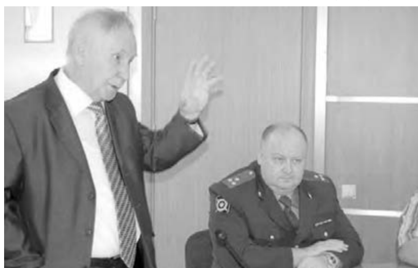
● Профилактическая работа в борьбе с преступностью по-прежнему актуальна.