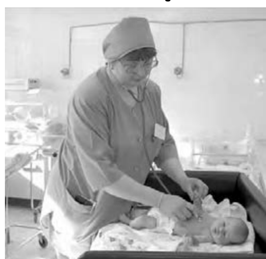
● «Нагрузка на работающие роддома возрастет...»

На время ремонтов пациенток закрывающихся роддомов будут перенаправлять в другие