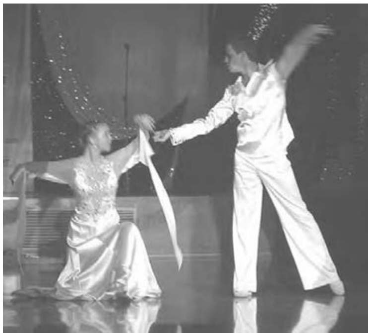
• Очаровательная пара из ансамбля «Оникс».

Открыла благотворительный бал в помощь юным талантам Магнитогорска жизнерадостная увертюра «Дети капитана Гранта» в исполнении симфонического оркестра Магнитогорского театра оперы и балета под управлением Сергея Приходько. Выступление дебютантов началось с торжественных шагов полонеза. Красивые лица, мудреные прически, изящество фигур и движений, завораживающий шорох длинных платьев и легкое постукивание каблучков – все это напоминало о балеске и великолепии старых балов. «Приятно, что в нашем городе возрождаются традиции русской культуры, истории своего народа, – сказал, обращаясь к участникам, заместитель главы городской администрации Сер-