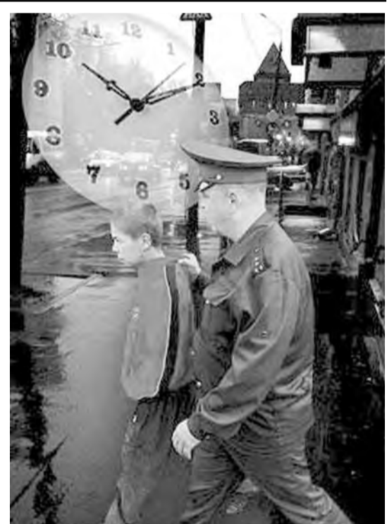
● Ночью – только с родителями или... полицией.

В целях предупреждения в дальнейшем преступлений со стороны несовершеннолетних