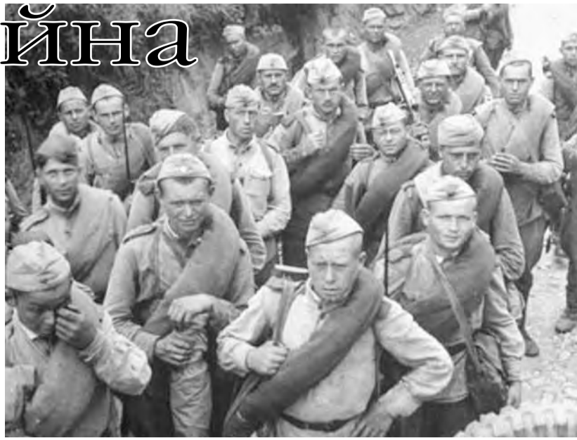
● Август 1945-го. Впереди поход через пустыню Гоби.