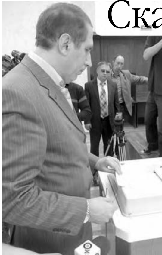
● Избирательные урны будут разговаривать с голосующими...

На выборах в Госдуму избирательные урны будут разговаривать с голосующими. Как выглядят новые КОИБы?