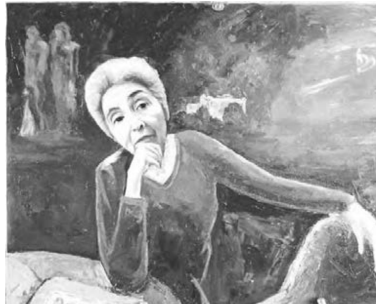
● Четверть века у доски – срок немалый...

Список конкретных должностей и учреждений, работа в которых дает право выйти на пенсию ранее установленного возраста, а также правила исчисления педагогического стажа для назначения пенсии утверждены постановлением правительства страны. В целом указанный список содержит наименования 26 должностей и более 60 учреждений. В Челябинской области трудится около 60000 педагогов-льготников и действует около 3000 таких учреждений образования. К ним относятся школы и