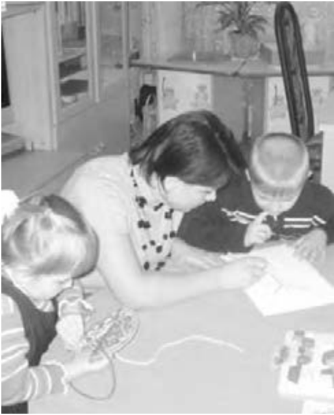
● В клубе идут занятия.

Для самих родителей предусмотрен целый комплекс меро-приятий в рамках социального проекта «Понимаю своего ребенка». Родители будущих первоклассников смогут встретиться со специалистами-психологами Центра социальной помощи семье и детям, логопедом, врачом-педиатром, а также получить консультации по вопросам воспитания, правильного питания, физического и психического здоровья детей.