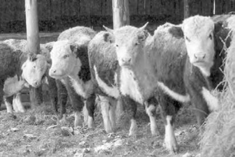
● Южноуральцы повезут в Москву племенных быков герефордской породы...

Изобилие колбасных изделий, продукции из мяса говядины, свинины, птицы предложат компании «Уралбройлер», «Ромкор», «Княжий сокольник», «Птицефабрика Челябинская». Широкий ассортимент кондитерских, хлебобулочных изделий, круп будут презентовать