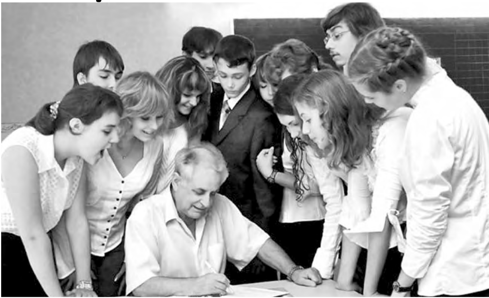
• С Днем учителя, магнитогорцы!