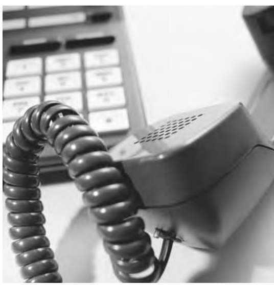
● «Вопросы, связанных с ЕГЭ, меньше не становится».

Информация о проведении Единого государственного экзамена в Магнитогорске будет размещаться на странице управления образования сайта администрации города ( http://www.magnitog.ru/ ).