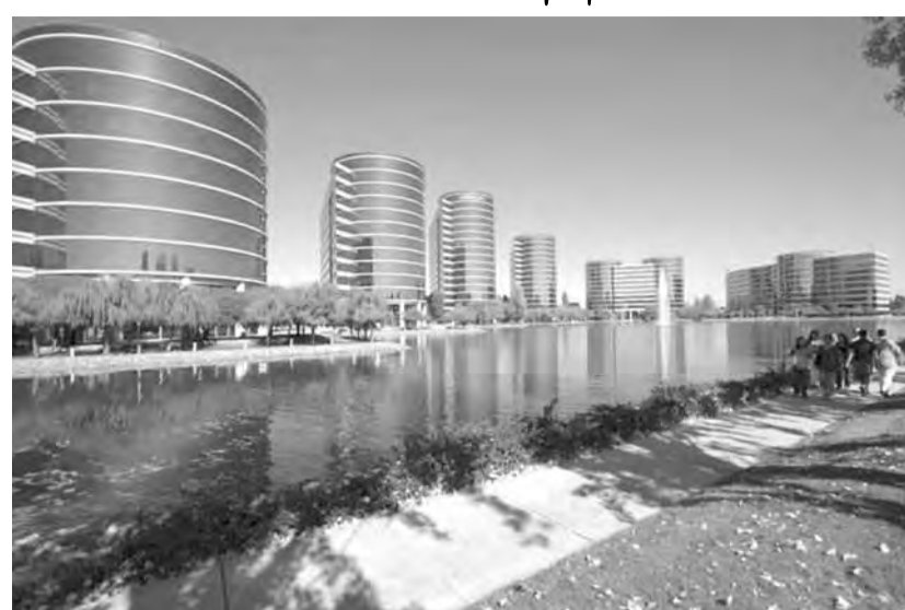
● В насыщенном графике визита также посещение Силиконовой долины...

Университет будет представлять Челябинскую область на заседании Американско-Российского делового совета «Россия на рубеже». Это единственный вуз УрФО, который