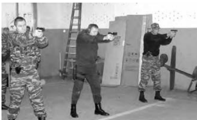
● В стрелковом тире.

Формирование сотрудников, изменение их менталитета – дело не одного дня и даже года. Как отметил глава МВД России Рашид Нургалиев, «авторитет органов внутренних дел в глазах населения мы можем поднять только своими делами, исключительной честностью и порядочностью каждого сотрудника, высокопрофессиональным и добросовестным отношением к службе».