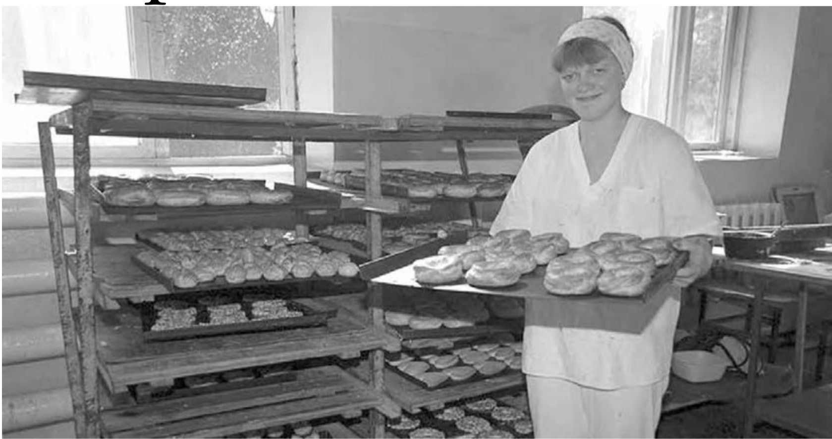
● Малому бизнесу готовы оказать поддержку.