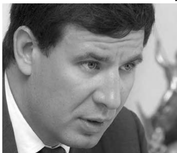
● Губернатор пообещал «показательные судебные процессы»...

Челябинская область не допустит накопления долгов по ТЭК через мошеннические схемы.