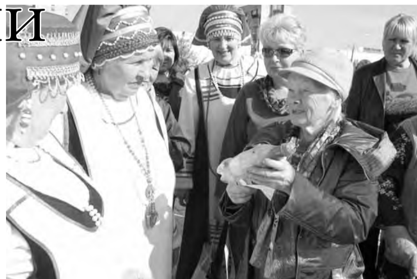
● Садоводам всегда есть чем поделиться.