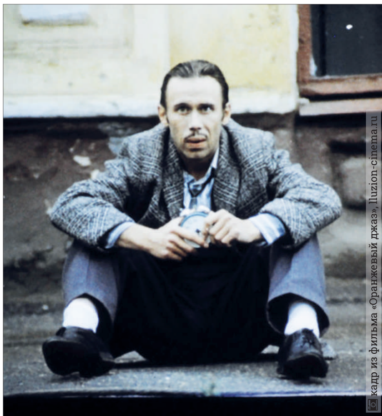
кадр из фильма «Оранжевый джаз»

телям, когда занимался здесь в театральном кружке.