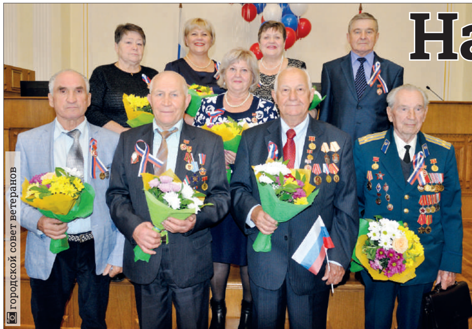
Городской совет ветеранов