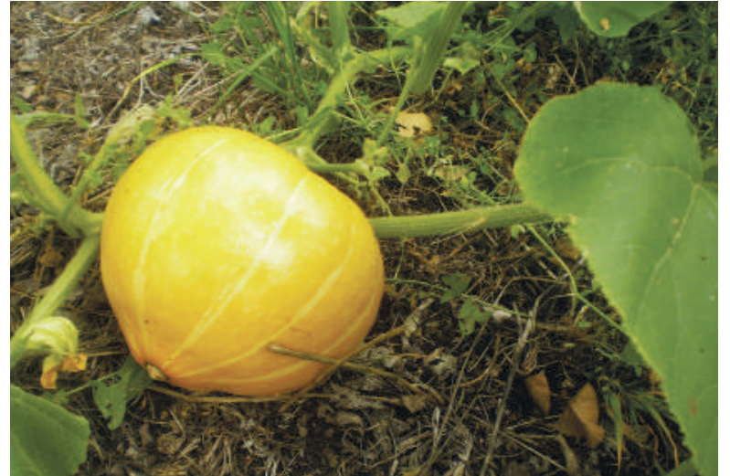
Вот такая тыква уродилась на моей «слоеной» грядке.

Копать ничего не надо, просто отгребите рукой