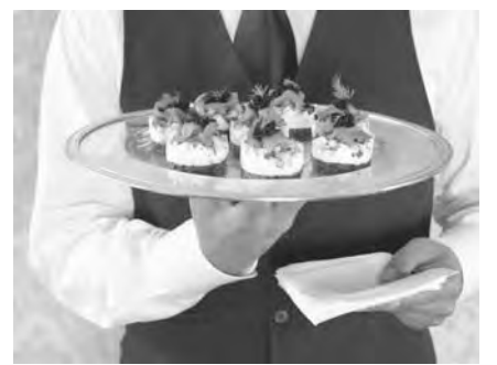
● Сколько будет стоить?

Что касается вопросов налогообложения, то большинство мелких ресторани-