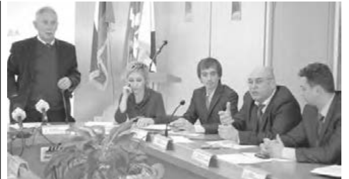
● Идет заседание общественной палаты.

На состоявшемся заседании также был принят кодекс этики членов Магнитогорской обще-