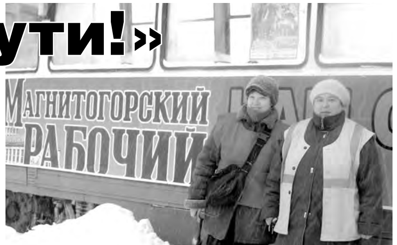
● С осени по улицам города ходит «наш трамвай».

Хотя водители считают наоборот. Проезд по проспекту на этом участке для них убыстрился в обе стороны.