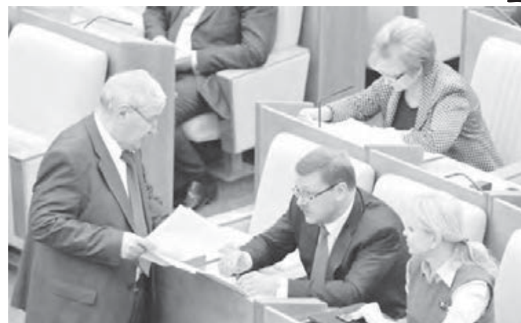
● На осенней сессии принято более 200 законов.

К примеру, о едином и самостоятельном следственном органе типа ФБР, но на российский лад у нас давно говорили. Идею примерять к российской действительности начали два года назад с создания Следственного комитета при прокуратуре. А в эту сессию Дума по инициативе президента узаконила право самостоятельного Следственного комитета РФ. «Тем самым сделан важнейший шаг на пути повыше-