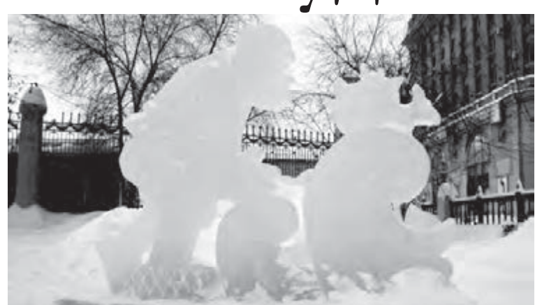
● Ледяная сказка в сквере Металлургов.