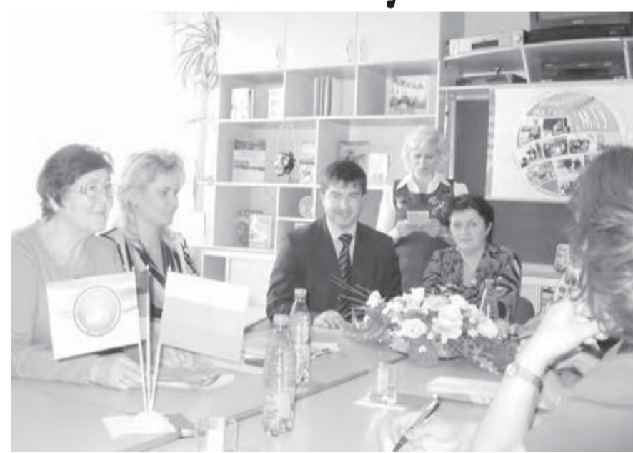
● На «круглом столе» с гостями из Германии.