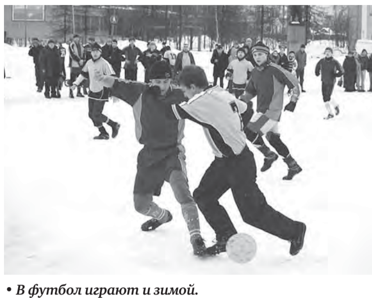
В футбол играют и зимой.

Его организаторами на протяжении многих лет выступают ОАО «Магнитогорский металлургический комбинат», администрация Ленинского района, Магнитогорское отделение партии «Единая Россия» и управление по физической культуре, спорту и туризму.