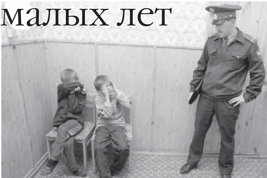
«Закрываются» дети – сигнал тревоги для страны.