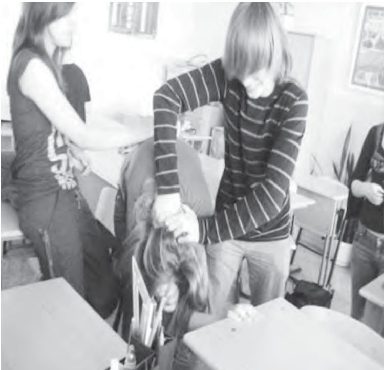
Кулаками правды не найти...

Случай, казалось бы, из ряда вон выходящий. Но, к сожалению, это совсем не так. Еще в