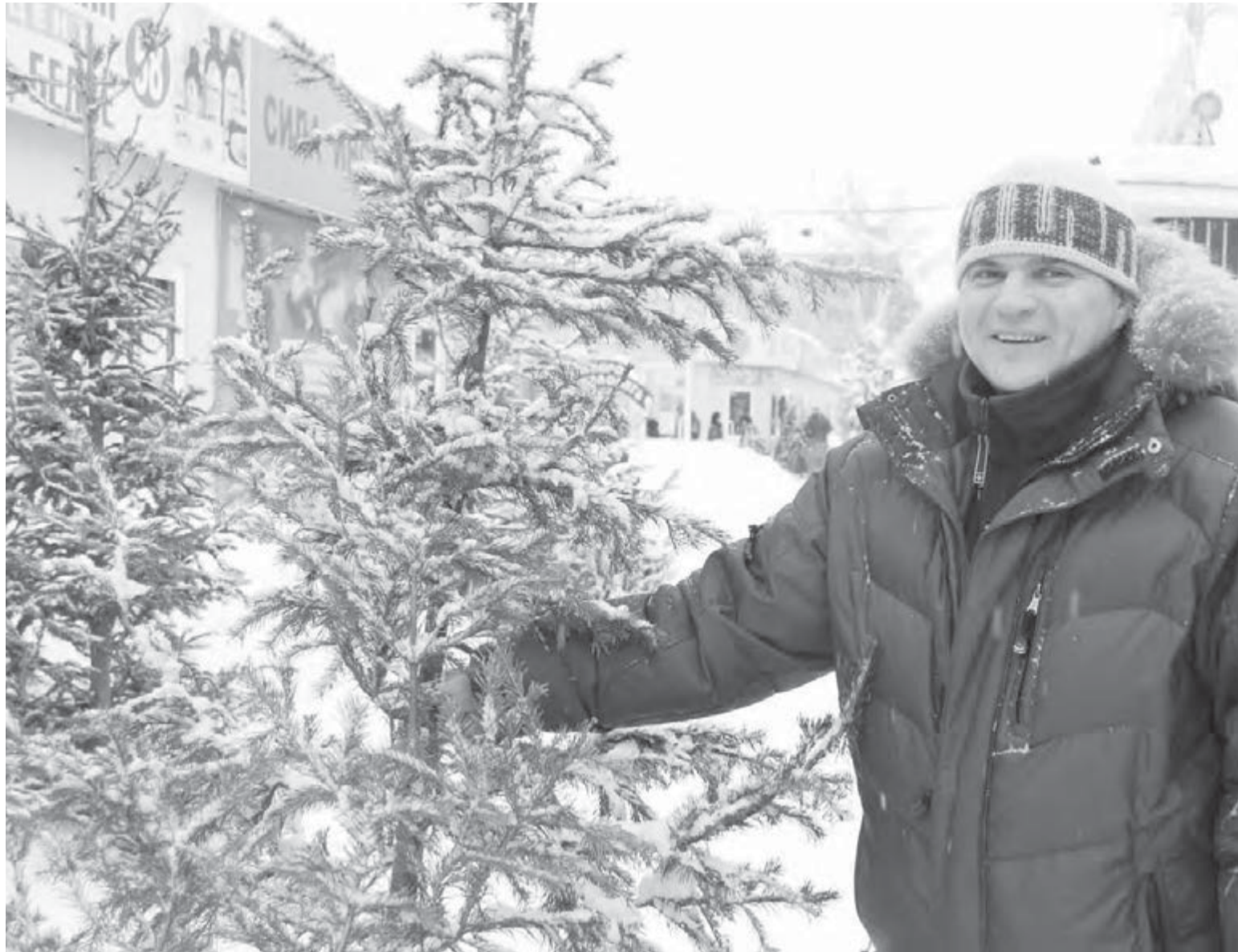
• Осталось принести домой и нарядить...