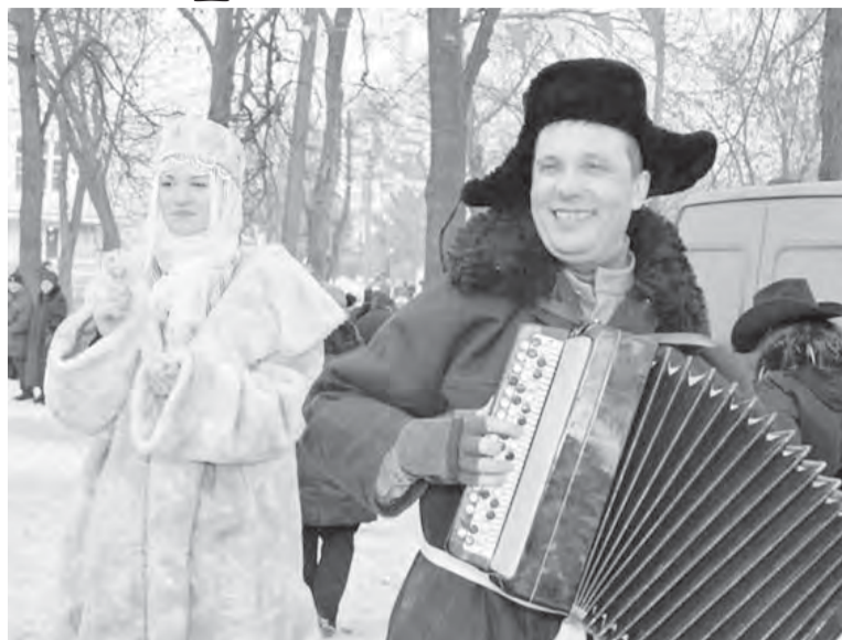
«Все равно мы пить не бросим...».

В декабре государство, как всегда, «радует» граждан, сообщая, насколько больше им придется платить в новом году за коммунальные услуги и транспорт. Эти «подарки» стали уже традиционными, и тому, что их нам всем «кладут под елку», никто уже особо не удивляется.