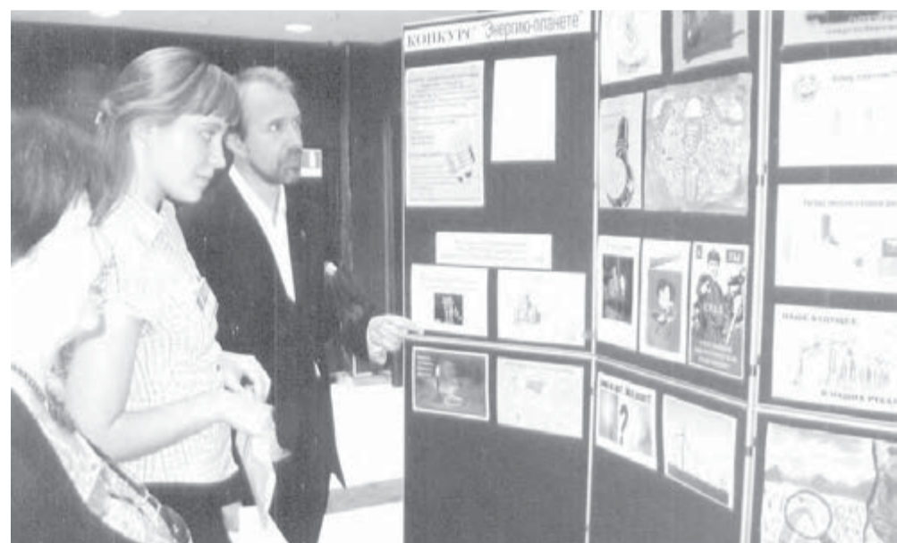
● У стенда с плакатами группы «Эковзгляд».