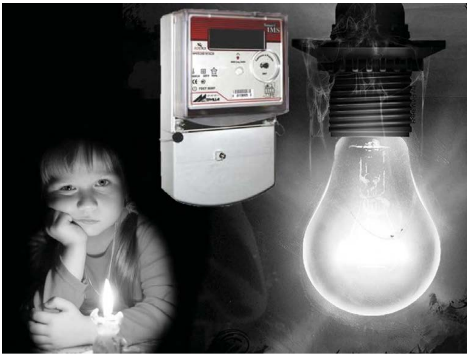
● В поселке Некрасова действует правило: достанешь свечку – топи и печку.