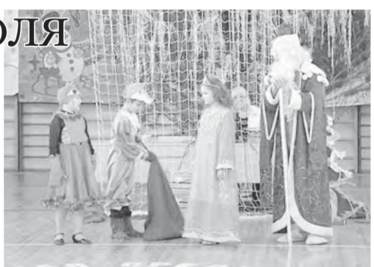
«Ничто не должно омрачить школьные утренники.»

Нынешний Новый год в собственных стенах отметят около тридцати процентов магнитогорских школ. Ребята готовят развлекательную, конкурсную программу, в активных залах идут последние приготовления, устанавливаются елки, электрическое оборудование. За безо-