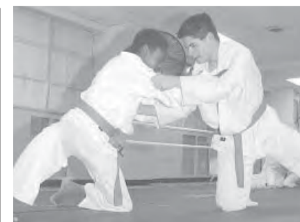
● Дзюдо — все в белом.