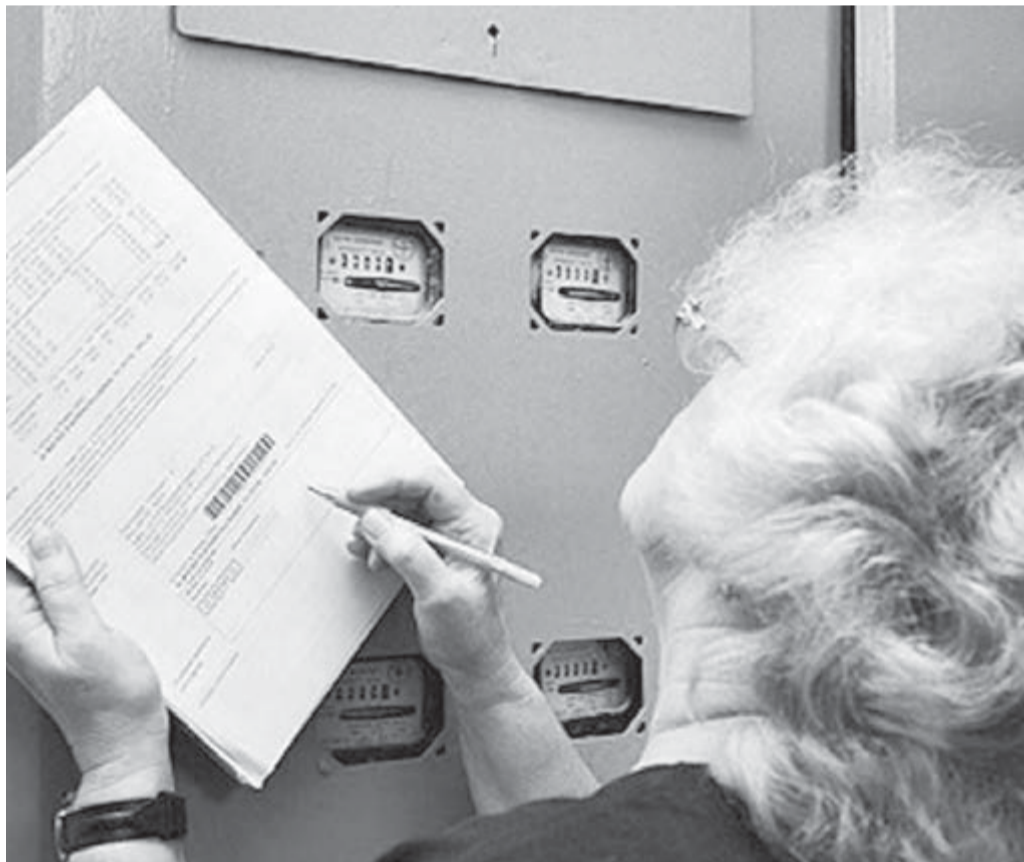
Что даст жильцу вхождение управляющей компании в систему СРО?

Более полную информацию можно получить по телефонам: (3519) 24-73-88, 25-45-73, 25-60-22.