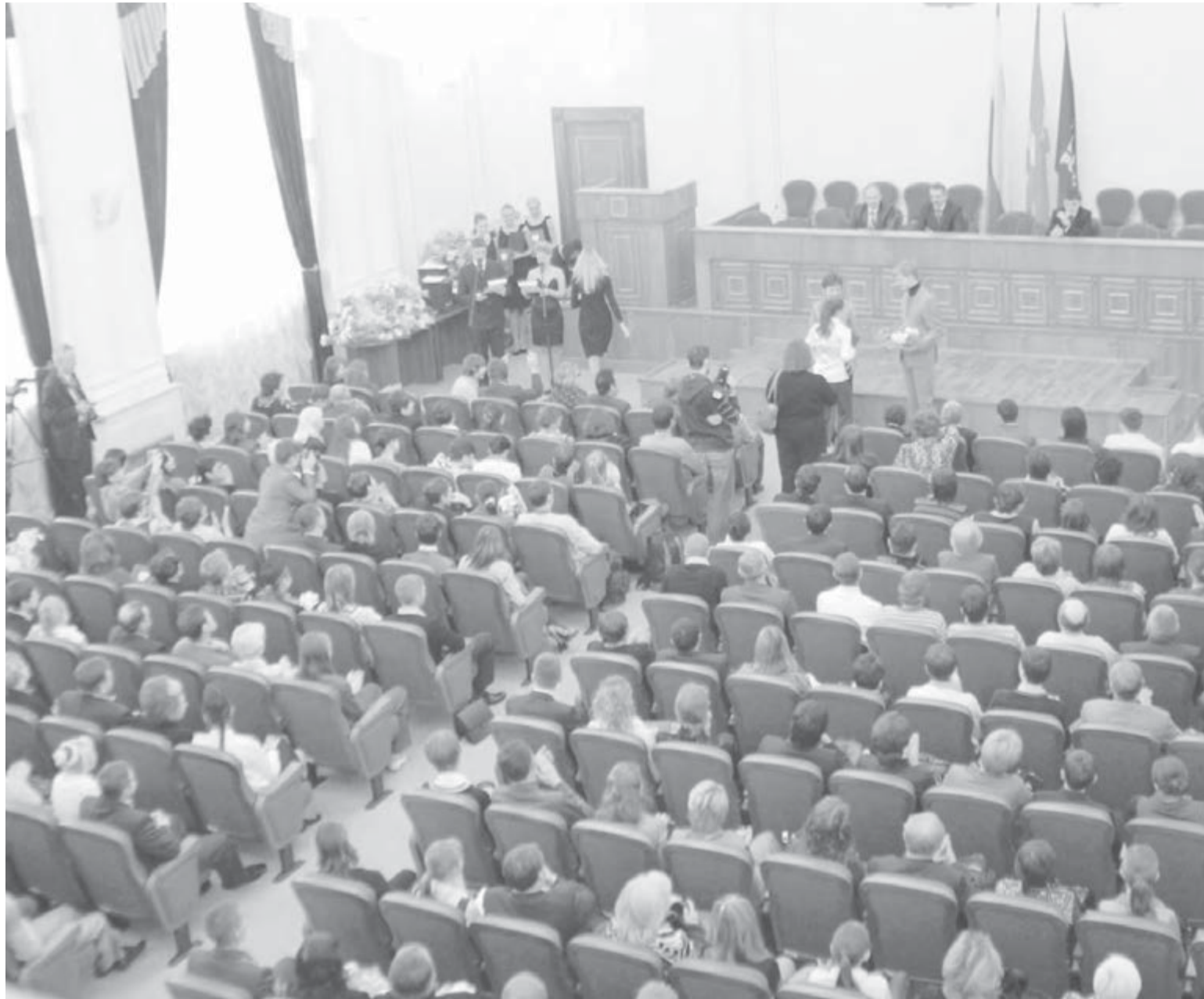
● Большой зал ЗСО едва вместил приглашенных юных талантов области.