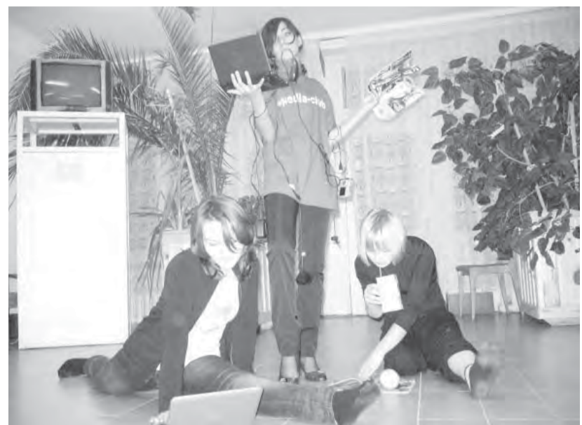
Юношкам талантов не занимать.

После городского фестиваля школьных газет и журналов такая поездка стала для нас новым испытанием на профессиональную прочность.