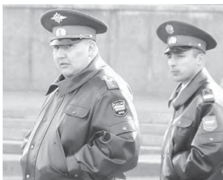
● Айн-цвай – полицейский...

Замечание о том, что граждане испытывают «раздражение» от переименования милиции, глава МВД парировал: «В 1993 году Верховным Советом было