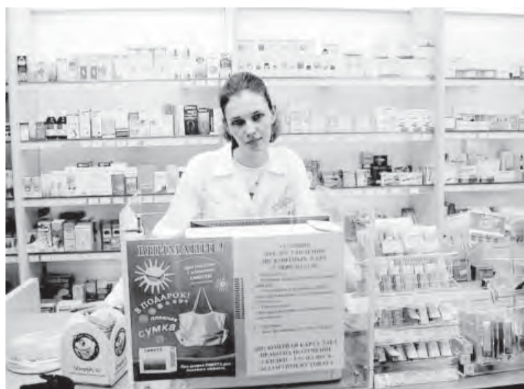
● Цены на лекарства не могут не тревожить.

«Для определения динамики уровня розничных цен в амбулаторном сегменте проанализировано 20 позиций лекарственных препаратов конкретных заводов-производителей у 10 юридических лиц, участников мониторинга Росздравнадзора в октябре-ноябре текущего года», – прокомментировала начальник управления лекарственного обеспечения и медицинской техники министерства здравоохранения