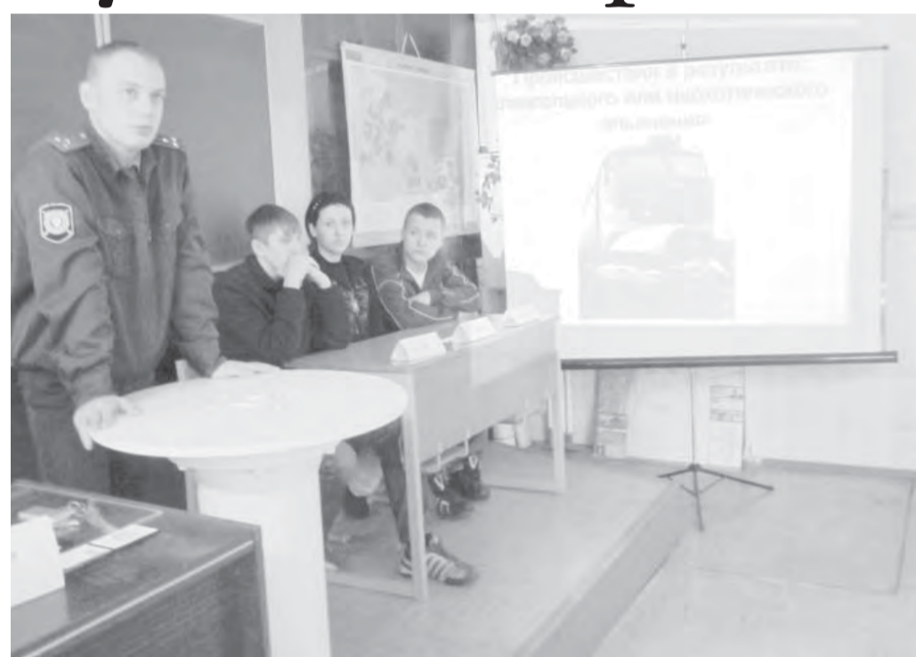
● «Прокурор» настаивал на высшей мере.