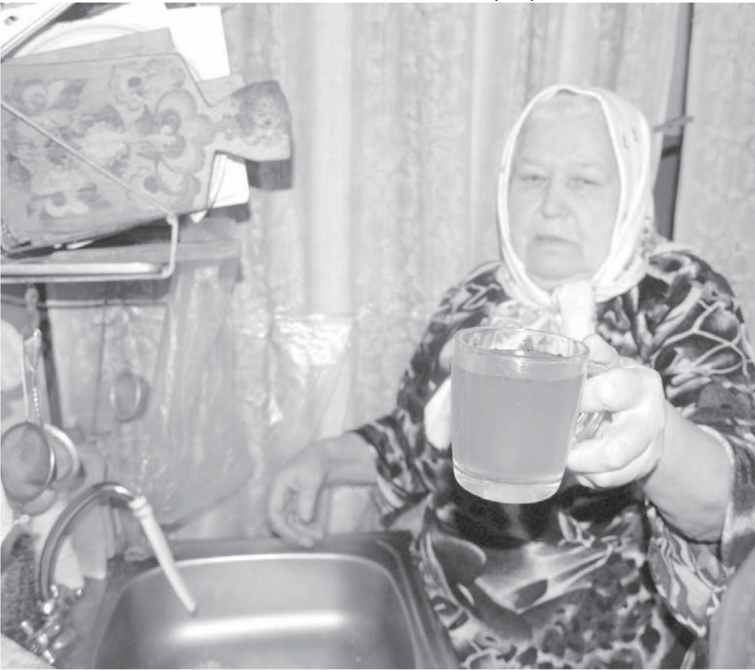
● Аварию устранили, но осадок остался.