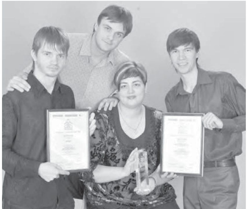
Эта четверка из МаГУ работала на «пятерку».