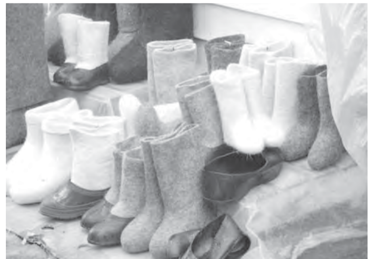
● Многие безработные рассматривают как вариант занятости изготовление валенок.