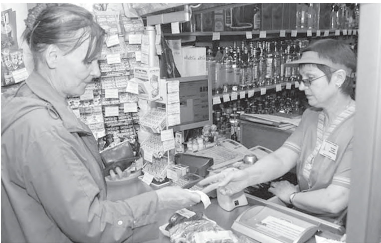
• Сверяйте цены, не отходя от кассы.