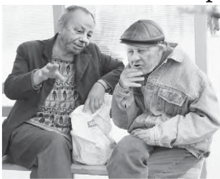
● Главное – самому не потеряться.