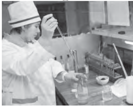
● Безопасен продукт, прошедший проверку.

Специалисты госветнадзора, а их в нашем городе представляет областное государственное учреждение «Магнитогорская городская ветеринарная