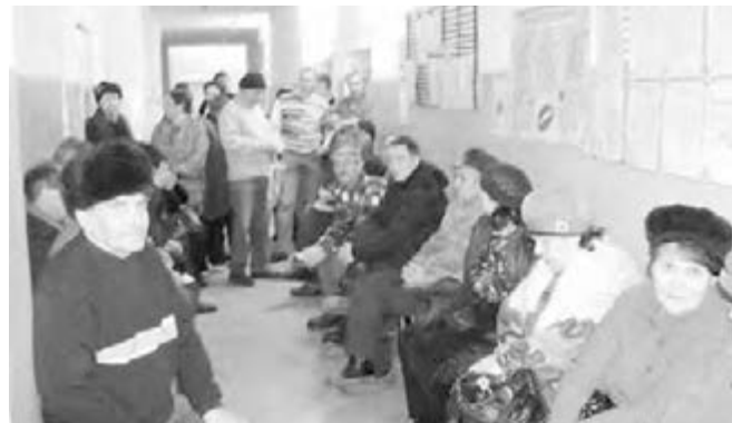
● Прививка защитит и от болезни, и от траты времени в очереди к врачу.

В Челябинской области по итогам последней недели отмечено превышение эпидемиологических порогов по гриппу и ОРВИ на 10 процентов. Основной «вклад» в показатели заболеваемости вносят дети в возрасте до двух лет, сообщает служба по надзору в сфере защиты прав потребителей и благополучия человека России. По данным ведомства, в семи субъектах идет превышение эпидпорогов на 10–22 процента, среди них и наша область. В Челябинской области за указанный период диагноз «ОРВИ» и