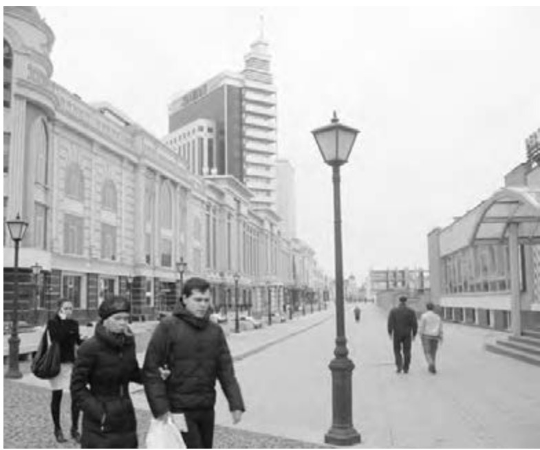
● Город славный, город «справный»: красиво, чисто и светло.