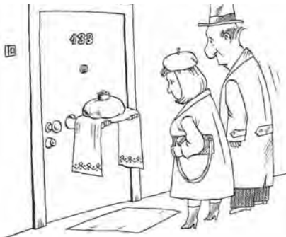
Рисунок: Мария СМАГИНА

«И счастье скажет «здрасьте» народам всех пород. Вперед! Перед прекрасен и светел наш перед!» – порадуемся вместе с поэтом и мы, поскольку завтрашний «перед» и в самом деле прекрасен – вряд ли во Всемирный день приветствий найдутся равнодушные к празднику люди. Главное, что делать ничего не придется, просто поздоровайтесь с теми, кто встретится вам на пути. Идя по улицам города, садясь в трамвай или в автобус, попробуйте приветствовать прохожих и соседей, пассажиров в транспорте, просто улыбнувшись. Пусть завтра (и всегда!), словно лампочки, включаются улыбки. Мелочь, а как поднимает настроение! И вам хорошо, и человеку приятно! А главное, не забудьте поздравить с этим праздником всех своих друзей и знакомых. Позвоните, напишите письмо с радужными приветствиями, назначьте встречу, придите в гости... Желайте здоровья, успехов, удачи и просто добра. Ведь если люди улыбаются, значит, они счастливы. Так пусть весь мир от наших улыбок станет светлее, добрее и радостнее!