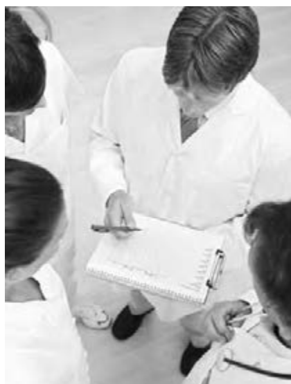
● Работа в новых условиях требует сосредоточенности.

Сегодня в системе здравоохранения области намечаются существенные изменения. Прежде всего речь идет о программе модернизации всего здравоохранения, принятии нового закона об обязательном медицинском страховании, изменении правового статуса государственных и муниципальных медицинских учреждений. Для того чтобы медицинские учреждения нашей области смогли эффективно работать в новых условиях, для их руководителей в Магнитогорске был организован семинар на тему «Реформирование системы обязатель-