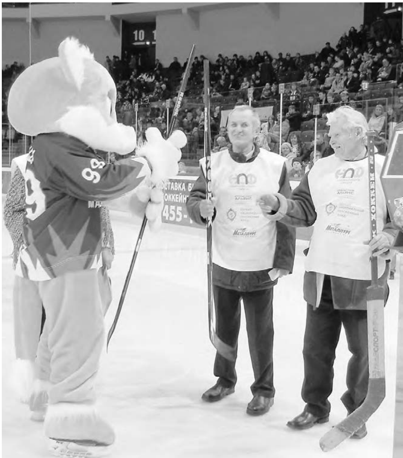
● С такой солидной поддержкой «Металлург» всегда будет на высоте!