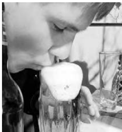
● Не пей – тельном станешь!

Южноуральские депутаты поддерживают законодательное признание пива алкоголем.