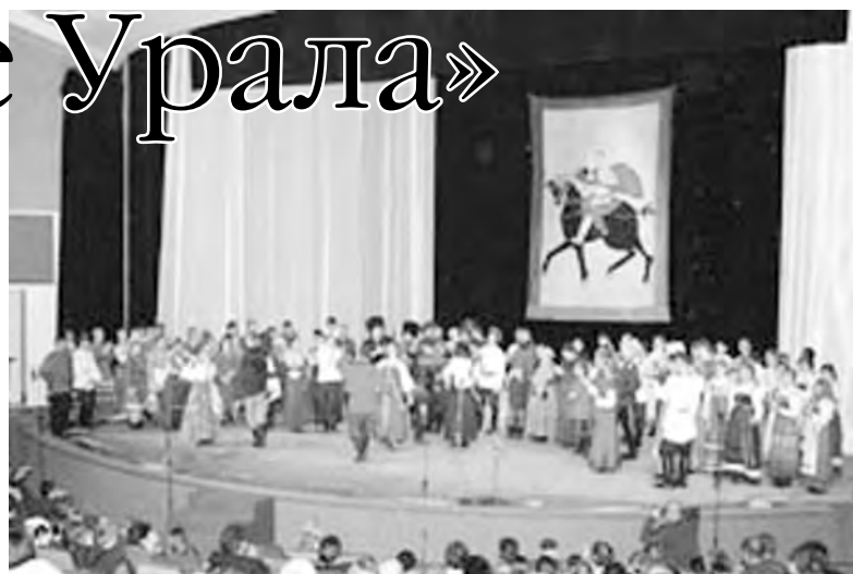
• В Дмитриев день веселились от души.

В заключительный день был традиционный молебен. Он проходил в парке городского Дворца молодежи. Молебен посвящен памяти павших воинов, в честь которых и учрежден праздник хранителей традиций и защитников Отечества. Дмитрий Солунский является покровителем воинов, сражающихся за правое дело. В честь покровителя «православного рыцарства» писали иконы, воздвигали храмы. Победу на Куликовом поле приписывали его заступничеству – существовала легенда о появлении Дмитрия среди русских полков в решающий момент битвы. С тех пор уже 600 лет в этот день на Руси помнят всех, сложивших голову на поле брани. В старой Руси Дмитриев день был в числе больших государственных праздников, теперь он возрожден. Исконный смысл Дмитриева дня как старого русского воинского праздника и дня поминовения предков получил новую жизнь в ставшем уже постоянным екатеринбургском фестивале традиционной мужской культуры «Дмитриев день». Его основная особенность – обращение к мужской аудитории, попытка заполнить пробел,