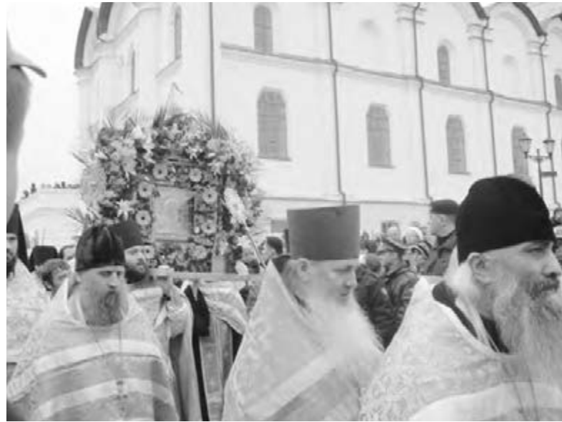
● Крестный ход по случаю праздника Казанской иконы Божией Матери собрал тысячи жителей и гостей Казани.

Чтобы не терять драгоценные минуты в ожидании главного действа дня, мы поспешили пройти по кремлевской земле, помнящей и болгарских эмиров, и золотоордынских ханов, и русских царей. Мощенная булыжником, единственная и главная улица крепости и сегодня сохраняет свой исторический облик. Отсюда тысячу лет назад начинался город, здесь же по сей день бьется живое сердце Казани. Почти рядом, по соседству,