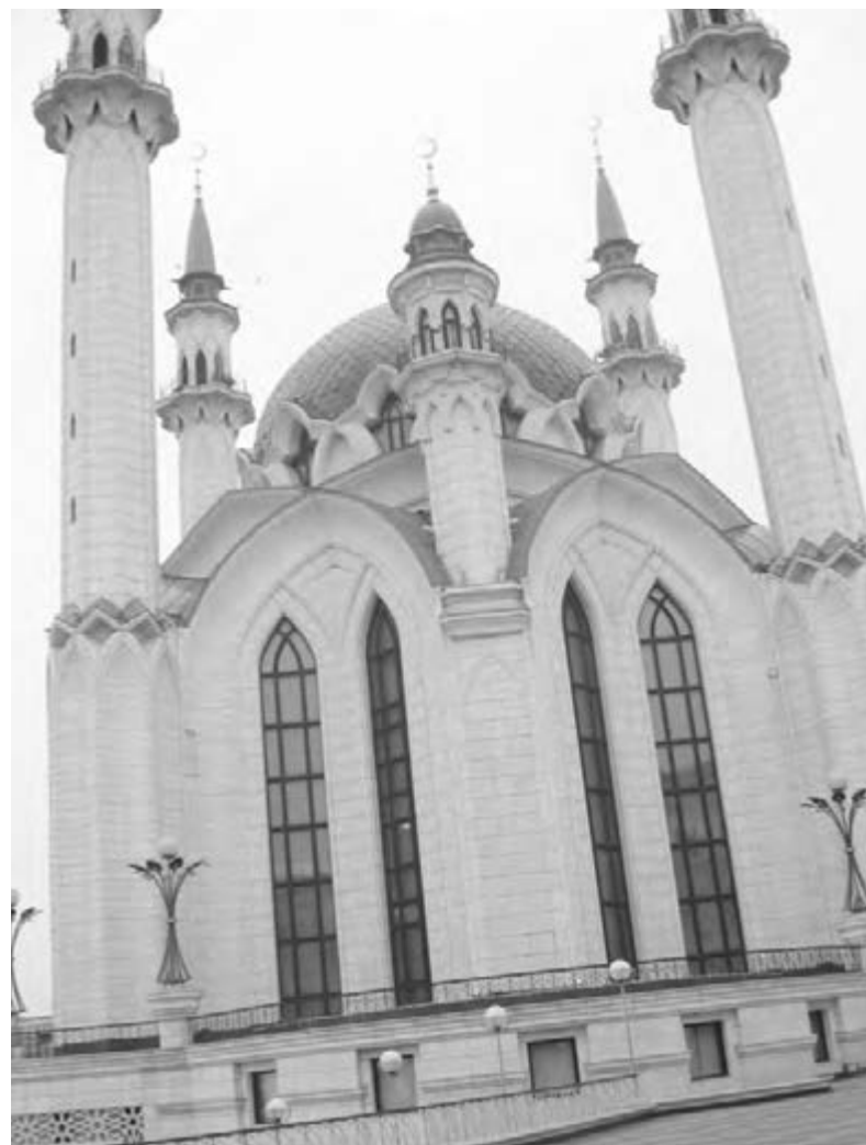
● Мечеть Кул-Шариф, возведенная и названная в честь легендарного духовного лидера и защитника татарской крепости, изюминка Казанского Кремля.

стоят за средневековыми стенами новая многобашенная мечеть, построенная в османском стиле, и древний православный собор, в котором когда-то в составе церковного хора пел сам Федор Шаляпин. Стоит подняться на Преображенскую башню под самую крышу – и весь центр города как на ладони! А угол наклона одной из самых высоких в Европе знаменитой «падающей» башни царицы Сююмбике можно увидеть и невооруженным взглядом: она отклоняется от своей оси на два метра. Интересна история этой башни, названной в честь последней казанской царицы. Согласно легенде Иван Грозный, узнав о красоте царицы, захотел взять ее в жены, однако получил отказ. Тогда Иван Грозный напал на Казань, и, желая спасти свой осажденный город, Сююмбике согласилась стать его женой, но с условием, что избранник за неделю возведет семиярусную башню. Когда просьба была исполнена, царица бросилась с этой башни вниз... На самом же деле судьба Сююмбике