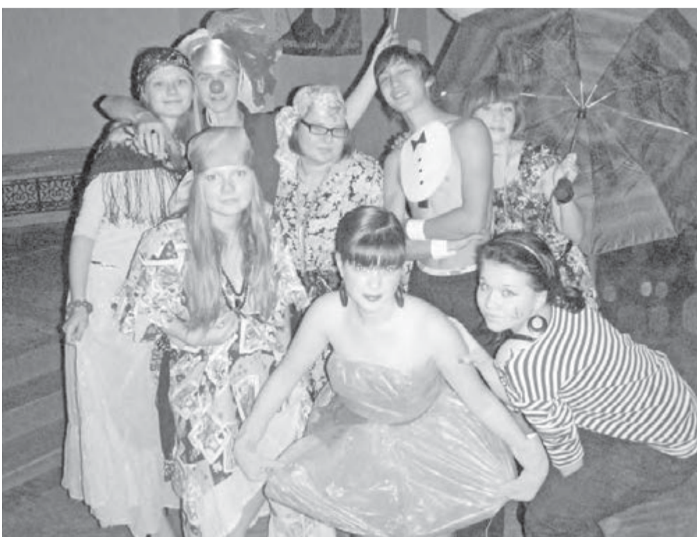
● «Островитянам» из МаГУ любые бури не страшны!