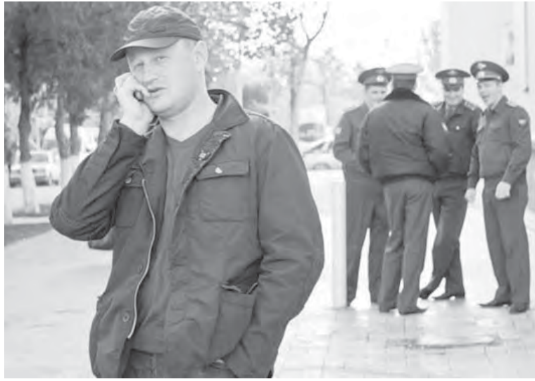
● «Первый, первый, объект на месте!»

Еще одним обязательным условием для новой службы, по мнению экспертов, должна стать установка камер наблюдения во всех отделениях и участках полиции. Чтобы в участке из человека не выбивали любые показания и не сделали невинного преступником, важно, чтобы отделения находились под постоянным контролем. При этом доступ к записям, по