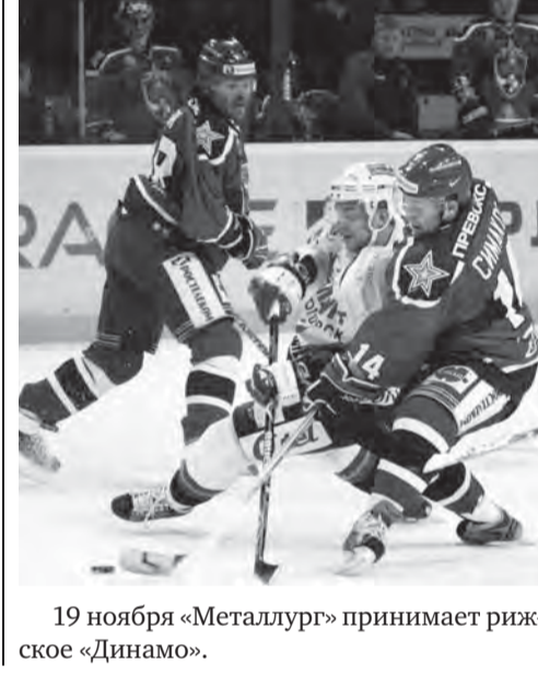
19 ноября «Металлург» принимает рижское «Динамо».

«Мы очень слабо начали первый период, допустив много ошибок, - поделился впечатлениями главный тренер ЦСКА Сергей Немчинов. - Затем нам было очень сложно отыграться, поскольку «Металлург», поведя в счете, полностью владел инициативой и контролировал ход встречи. Во второй трети матча мы перешли на игру в три звена, создали много голевых моментов, однако реализовать их не сумели. Согласитесь, тяжело одерживать победы, не забывая ни одной шайбы».