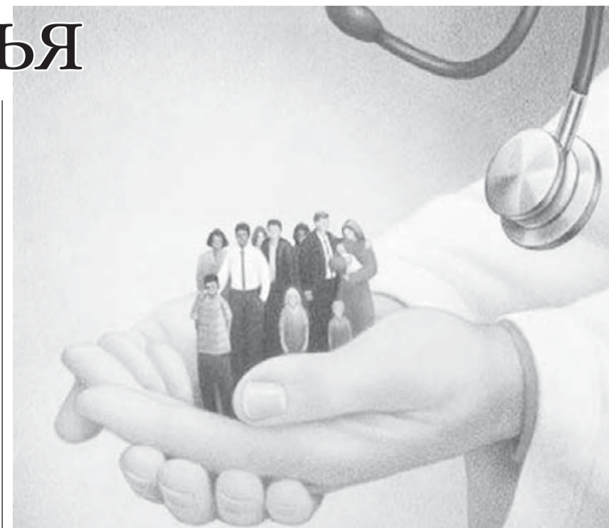
● И тебя вылечат, и меня вылечат. Те, кого выберем мы.

– При временном выезде за пределы своего города необходимо брать полис с собой, – предуп-