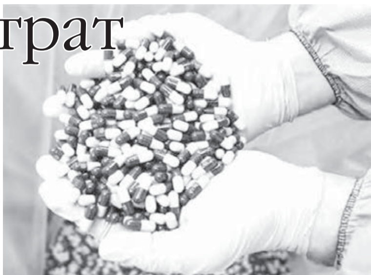
● «Выделенные на лечение пациентов средства не должны утекать сквозь пальцы».

Кроме того, сообщает пресс-служба ЧОФОМС, склад возьмет на себя ведение претензионной работы с поставщиками, что во многом облегчит работу медицинских учреждений. Это при-