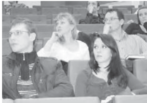
● Бизнесменами не рождаются, ими становятся.

На сей раз это был бесплатный семинар, организованный городской администрацией при участии консалтинговой компании ООО «Синай». На учебу собрались руководители отделов, командиры производственных звеньев, директора, менеджеры и другие специалисты, занятые в сфере малого и среднего предпринимательства, бизнесмены, занимающиеся развитием и совершенствованием деятельности своих