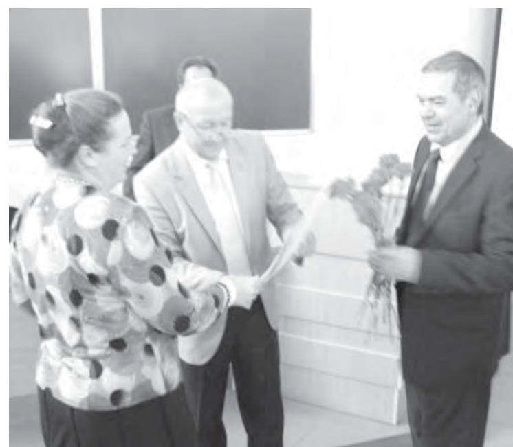
● Качество во всем – главный принцип «качественного» факультета.

Факультет технологии и качества был открыт в 1968 году.