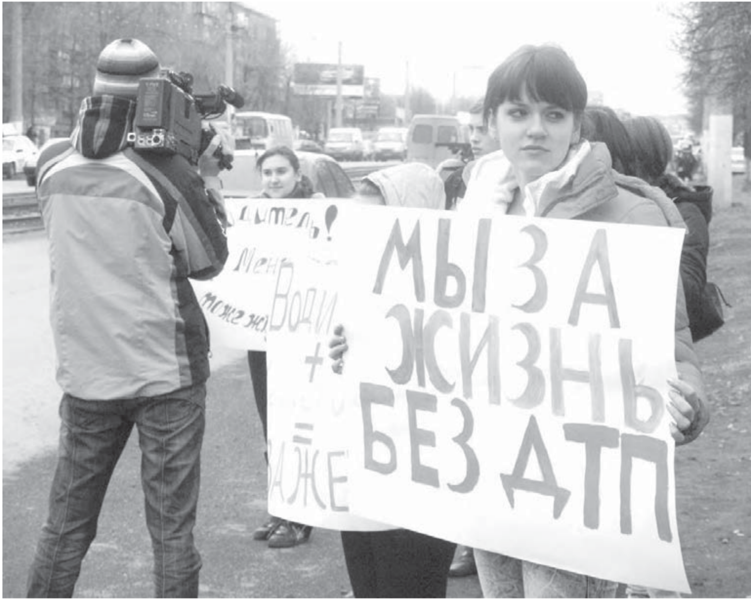
● Призыв молодых магнитогорцев был услышан. Хотя бы на один день.