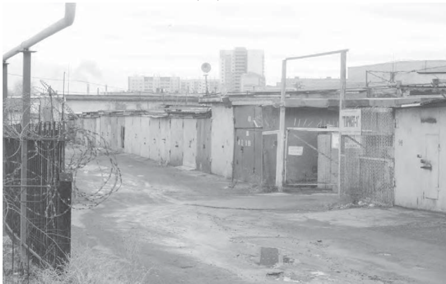
● Пунктам по приему металлолома удобно затеряться в лабиринте гаражей.