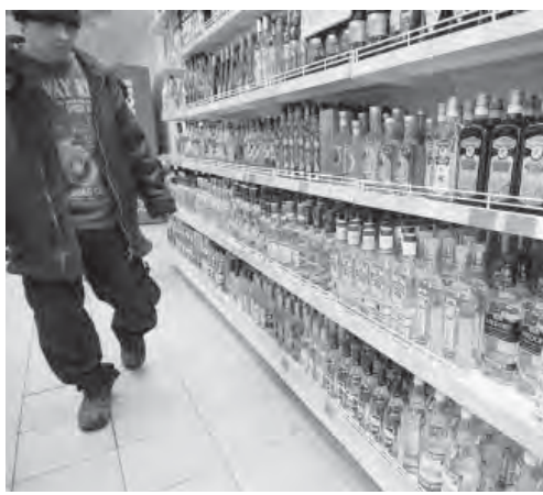
● А для тебя тут ничего нет, малыш!

Владимир Путин отметил, что в России многое делается «для гуманизации системы наказаний, смягчения ответственности за незначительные преступления». Но есть случаи, когда нужно усиливать наказание.