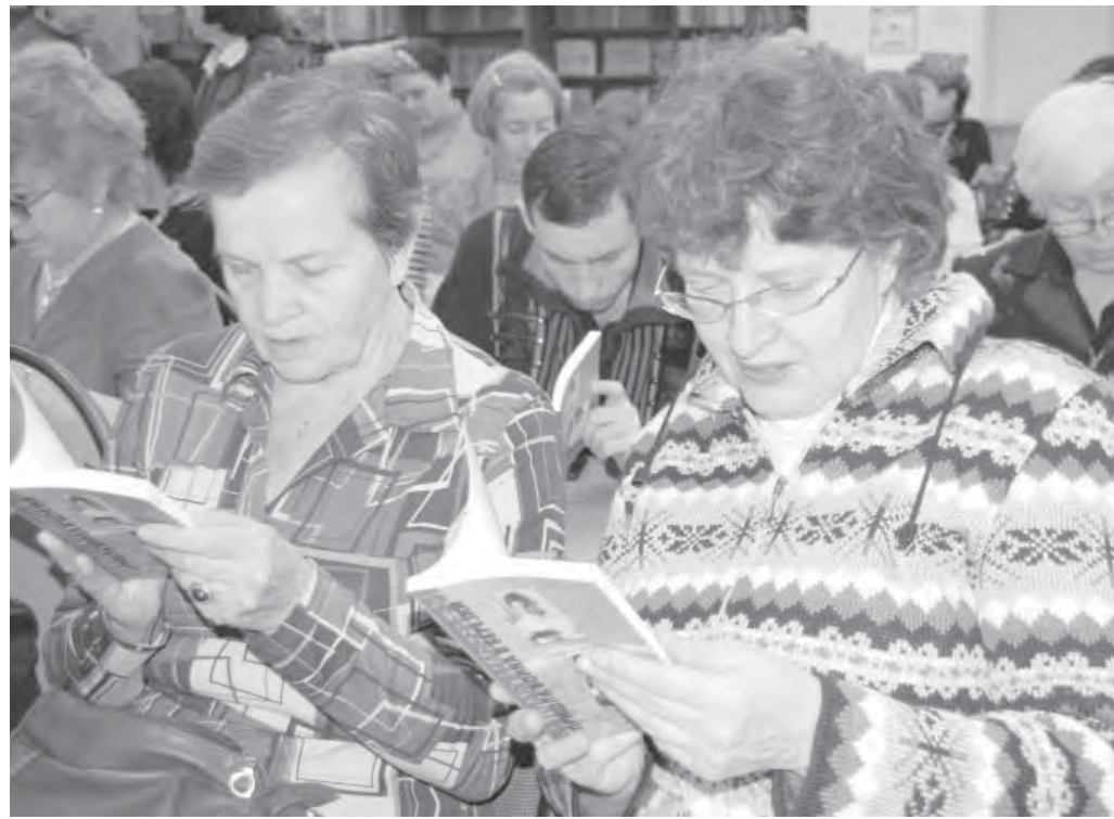
● Первые читатели книги «Пришла война в Березки».