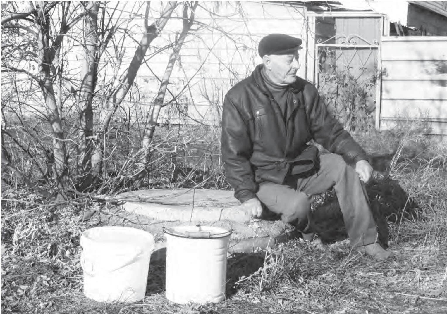
● Сейчас все надежды ветерана войны – на водовозку.