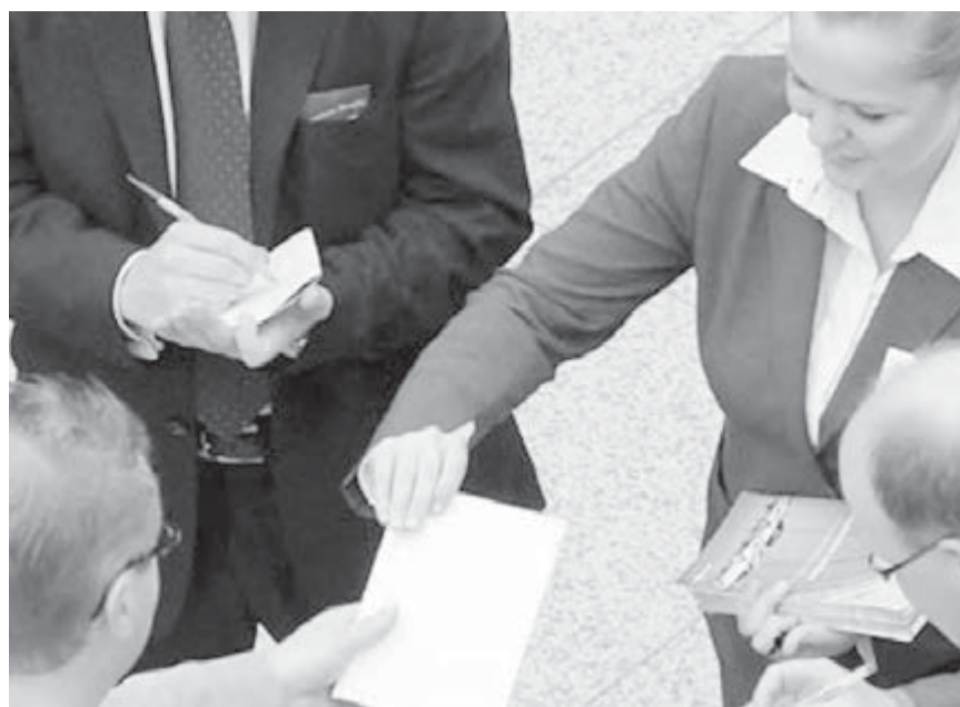
Обмен мнениями был полезным.