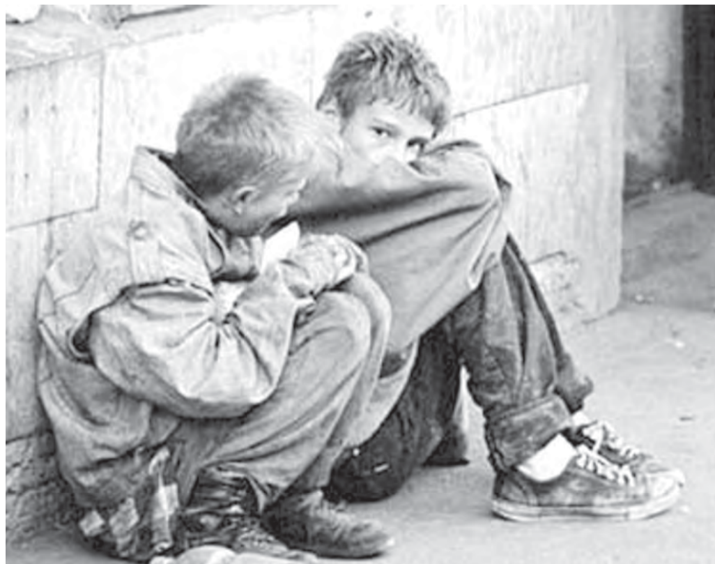
● Беспризорность – позор для общества.