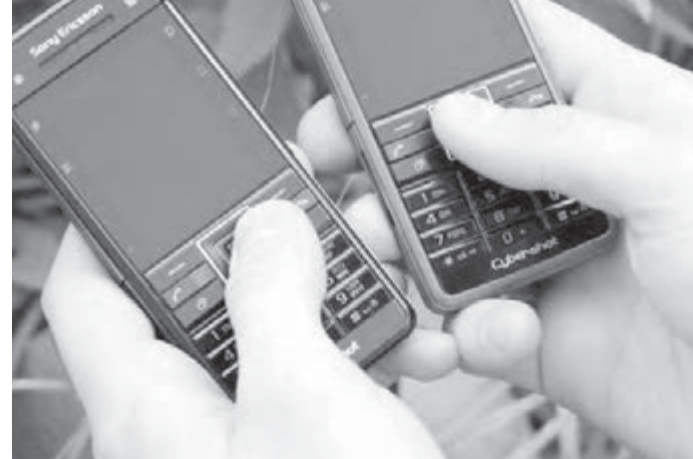
«Махнем не глядя» – это не по правилам.

Федеральная служба по надзору в сфере защиты прав потребителей обращает внимание граждан на аспекты правового регулирования отношений в случаях, когда продавцы сотовых телефонов отказываются покупателям в обмене товара на аналогичный другой модели.