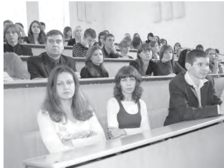
● Участники конференции.