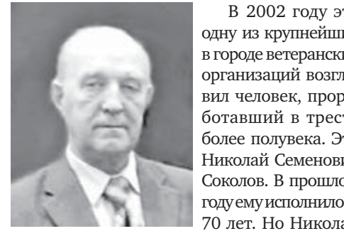
Семенович не поддается возрасту, бодр и деятелен.

В настоящее время в «Магнитострое» 36 советов ветеранов, которые объединяют более четырех тысяч пенсионеров.