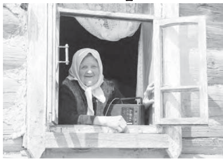
Перепись 2010 года заглядывает в год 2050.

Бесхозную коробку недалеко от главного входа в здание УВД на улице Урицкого обнаружил вчера рано утром дежурный сотрудник. По тревоге были подняты все экстренные службы города.