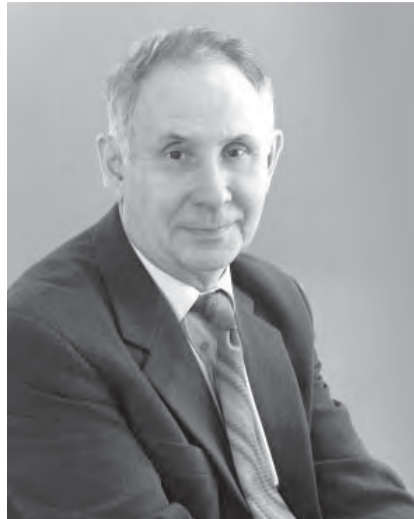
Валентин РОМАНОВ, президент МаГУ, почетный гражданин России