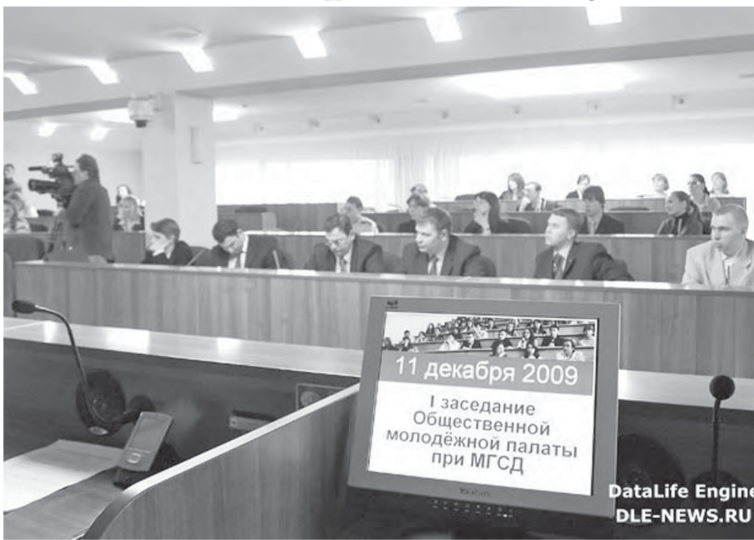
● За девять месяцев с момента первого заседания родился полноценный молодежный парламент.