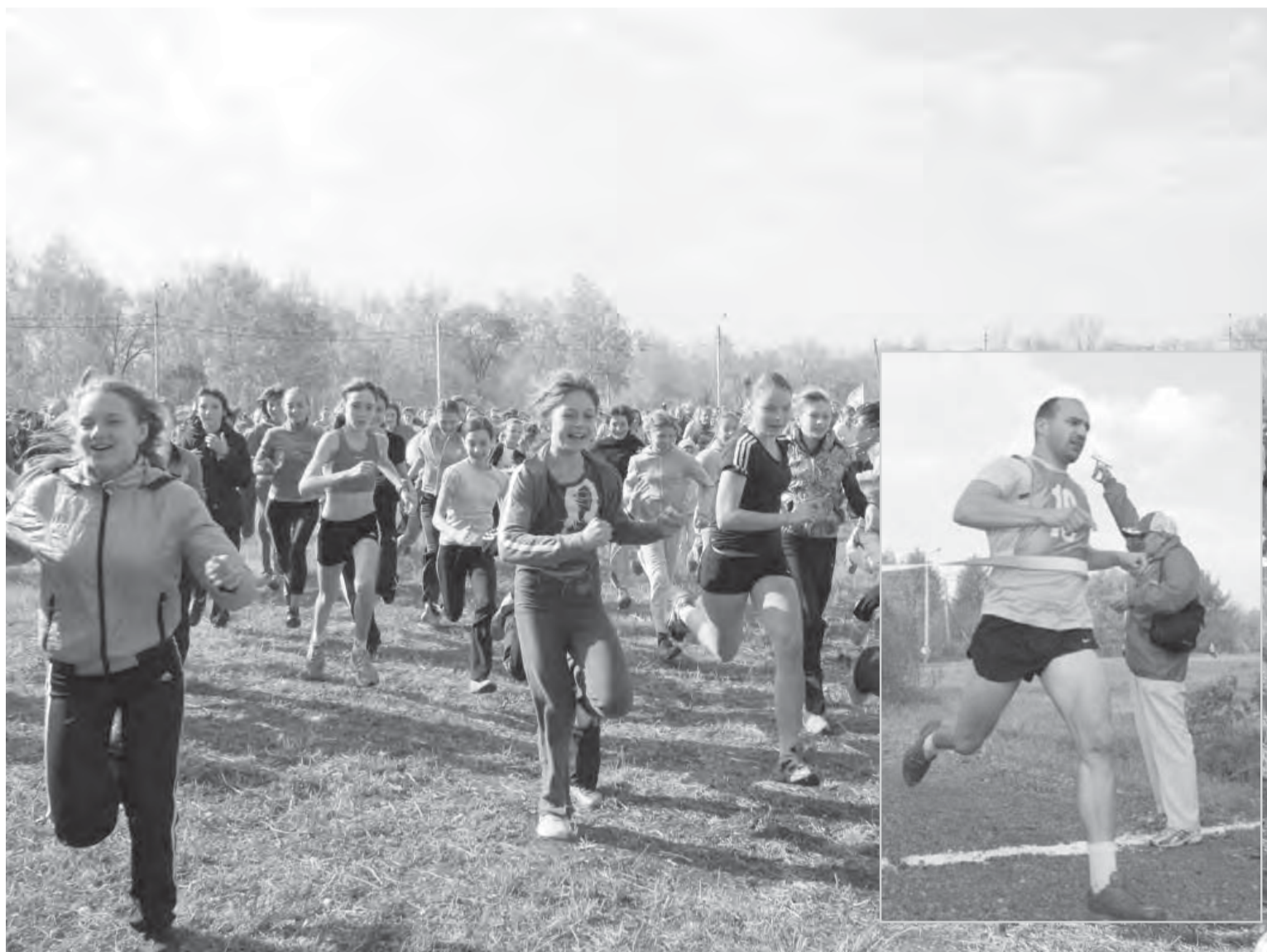
● В стартах «Золотой осени» приняли участие около двух тысяч магнитогорцев.