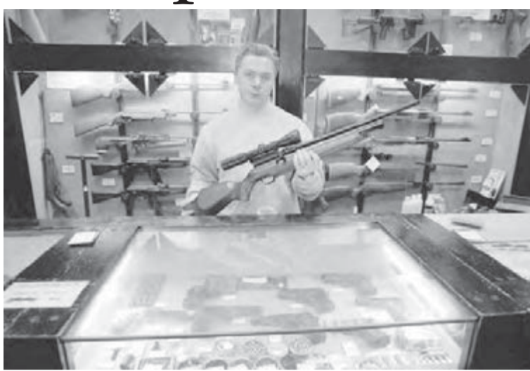
● А если поглядеть на проблему через оптический прицел?