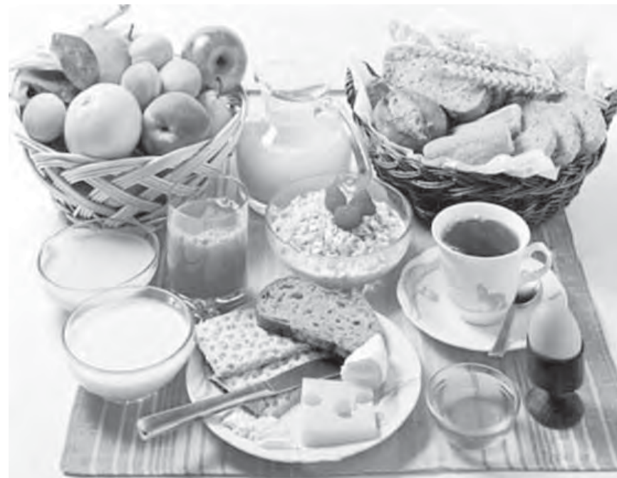
● Правильное питание – лишние годы жизни.

– Сад не считается. Монотонная работа в саду не идет в расчет. Там работает абсолютно другая группа мышц, не влияющая на работу сердца. Люди совсем перестали двигаться. Машины, работа за компьютерами – это отрицательно сказывается на здоровье. Появился ряд заболеваний у работников офисов, которые также приводят к ранней сосудистой патологии. Гиподинамия приводит к застою крови, и могут возникать венозные тромбозы, нарушается вязкость крови и прочее.