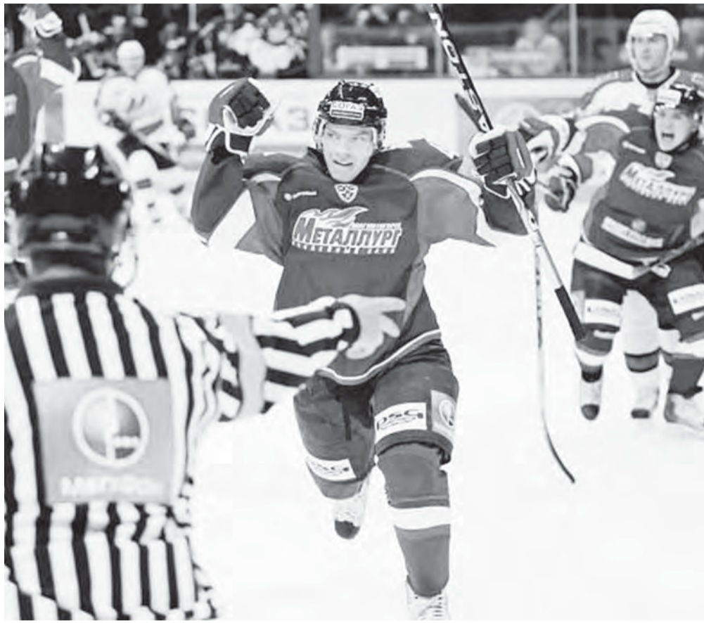
• Встреча с Новокузнецком. Еще одна шайба в воротах гостей.