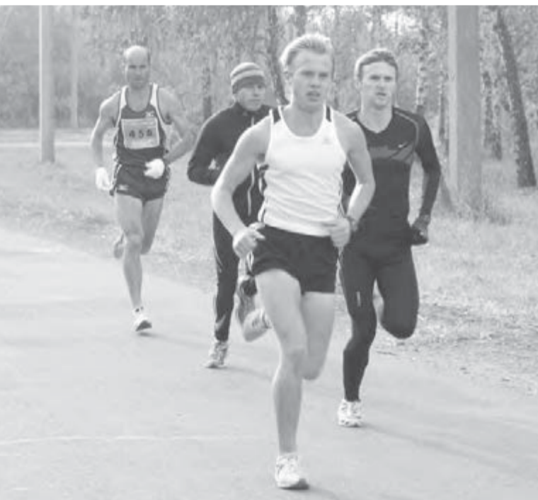
● На трассах забега развернулась нешуточная борьба.