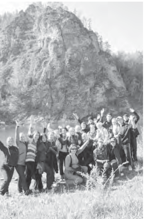
● На подступах к Каповой пещере.

... В одном из студенческих отчетов по результатам поездки я прочитала: «Я горжусь тем, что эта красота находится именно у нас, на Урале!».