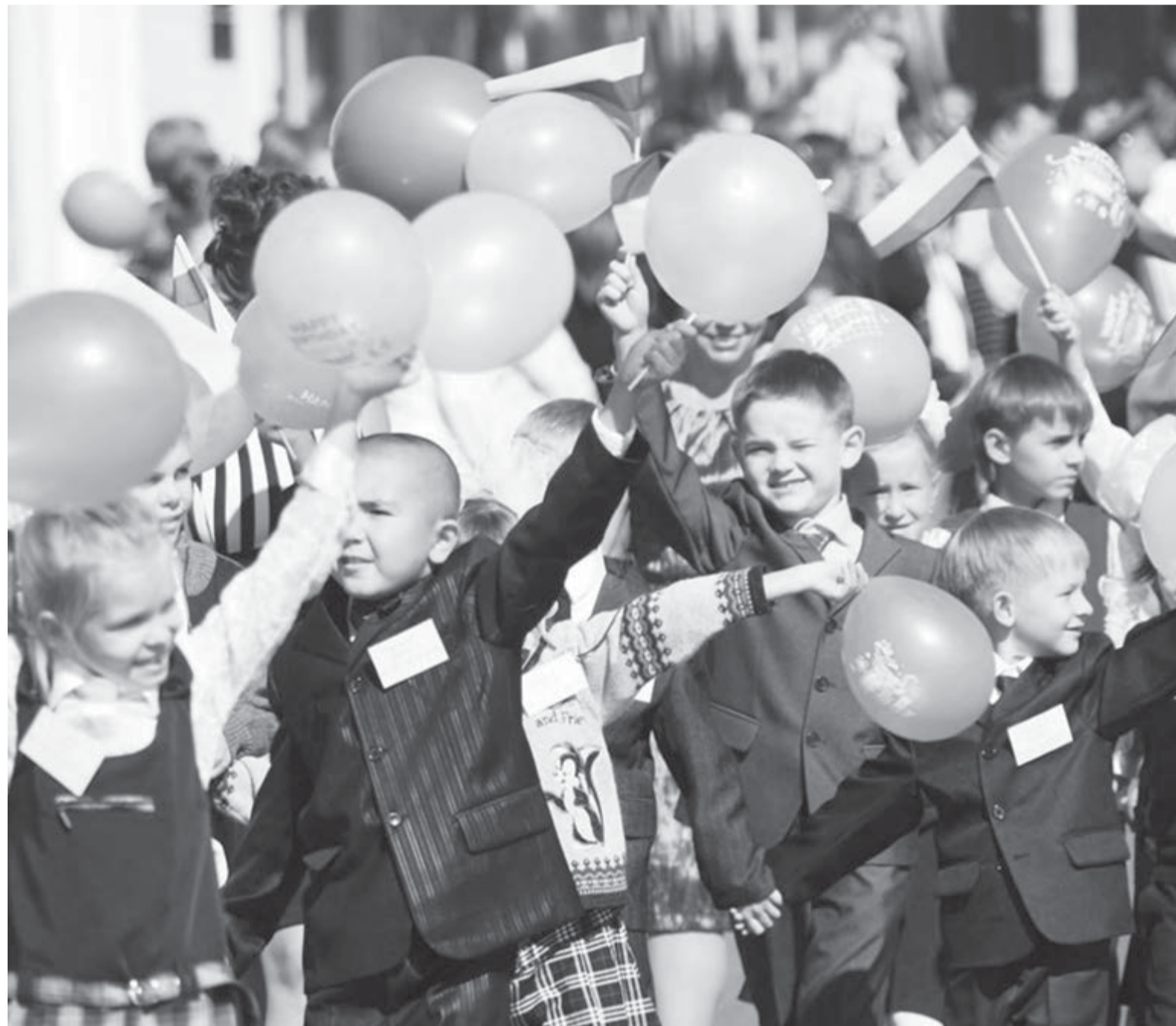
• День знаний в городе начался с парада первоклассников.