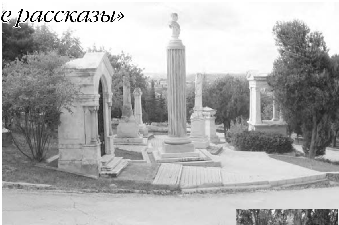
● Братское кладбище: здесь тихо, торжественно и очень красиво.

Сегодня о событиях тех далеких лет напоминают высокий обелиск, посвященный Альминскому сражению, и памятник особо отличившимся тогда офицерам и солдатам Владимирского полка. Имена и фамилии других участников Крымской войны значатся на многочисленных