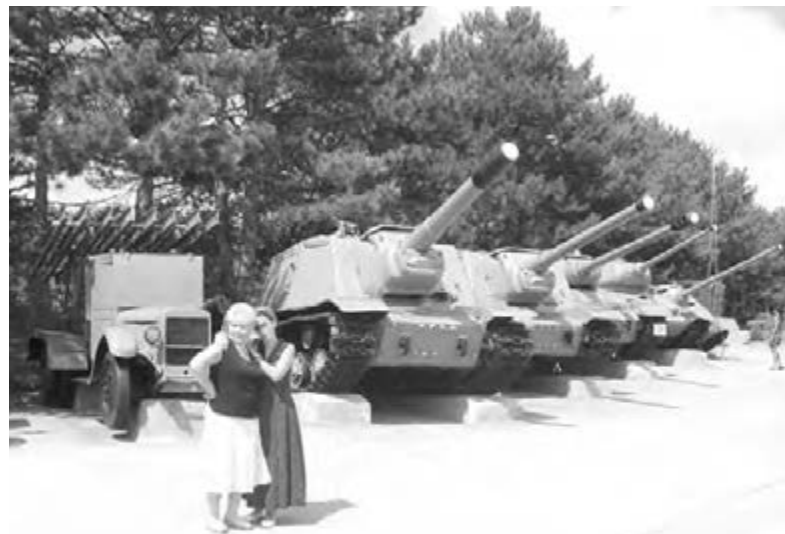
● Сапун-гора. Под открытым небом навечно умолкли боевые машины военных лет.

важности и значимости этого черноморского города в мировой истории, его громкой и немеркнувшей славы являются многочисленные «севастопольские» упоминания на карте как различных государств бывшего СССР, так и иностранных держав. Севастопольскими улицами могут похвастать Владикавказ и Самара, Новороссийск и Санкт-Петербург, Калининград, Тольятти, Нижний Новгород и еще не один десяток российских и украинских городов. В Париже, например, после Севастопольского бульвара можно пройтись по улице Малахова кургана и полюбоваться мостом Альмы. Название этой небольшой речушки, начертанное, к слову, и на одном из памятников в Лондоне, стало известно всему миру во времена Крымской войны и первой героической обороны Севастополя в 1854-1855 гг. На берегу Альмы русские войска встретили неприятеля, здесь произошло и знаменитое Альминское сражение. И хотя победу в этой битве благодаря преимуществу в своей численности и вооружении одержал противник, героизм и мужество, с каким сражались русские люди, во многом умаляли триумф англо-французской армии. Потери неприятеля были