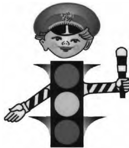
● Веселый светофорчик поможет на дороге.

Из них получили: Переломы – 8 человек Сотрясение головного мозга – 3 человека Раны – 5 человек Ссадины – 13 человек Прочие травмы – 8 человек