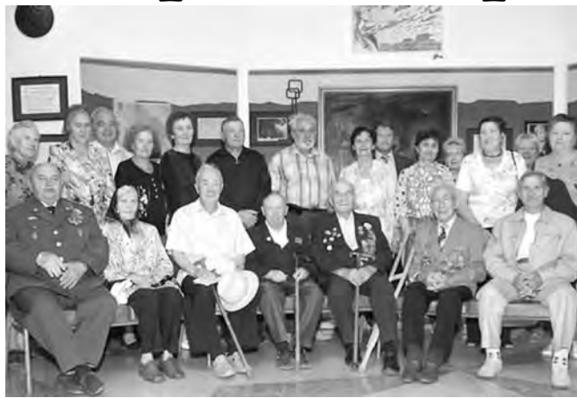
● Бойцы вспоминали минувшие дни...

В Магнитогорском краеведческом музее собрались ветераны – участники боев на Курской дуге.