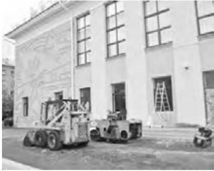
● У Дворца творчества быстрыми темпами идет благоустройство.

во встретить и проводить гостей – во Дворце имени С. Орджоникидзе состоится торжественная церемония открытия (24 сентября) и закрытия (2 октября) конкурса педагогов страны. И хотя Дворец выглядит вполне достойно, от взора главы не ускользнули такие мелочи, как непрезентабельный вид рядом стоящего жилого здания. Попытка изменения кем-то цвета его фасада привела к тому, что два аляповатых пятна теперь придется убирать. «Мелочей здесь не бывает, это тоже лицо города», – заявил глава.