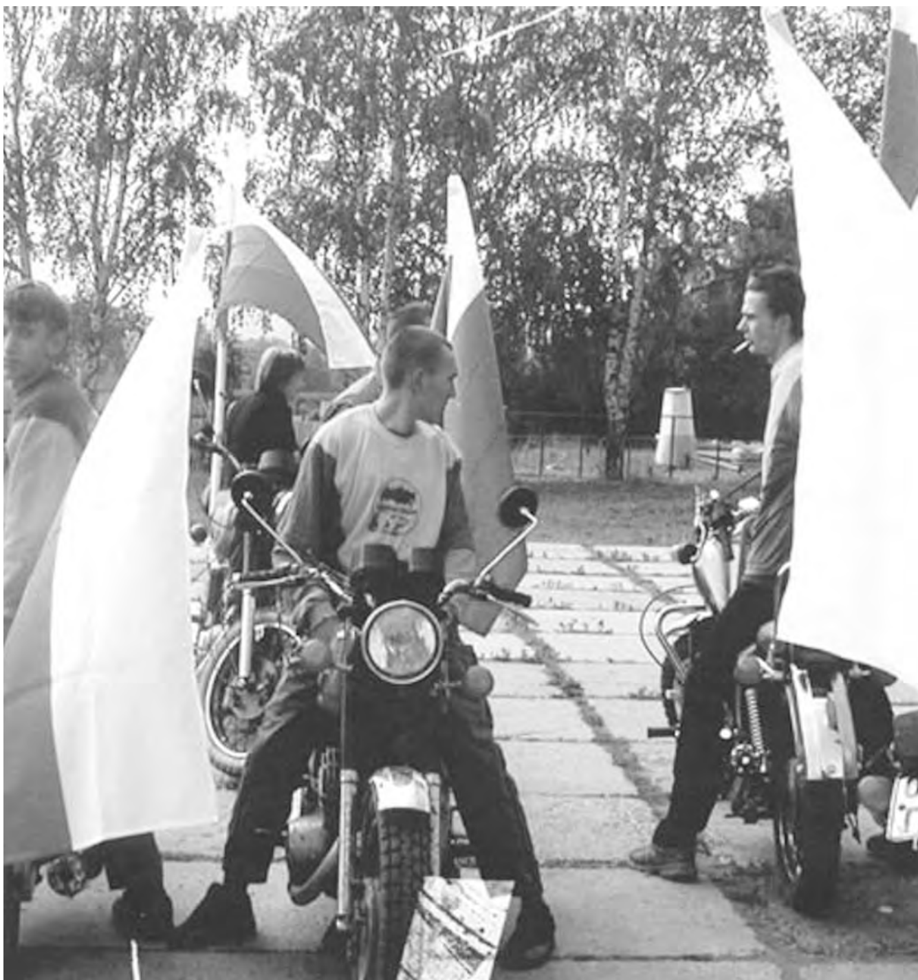
● Уважение к флагу воспитывают с юных лет.