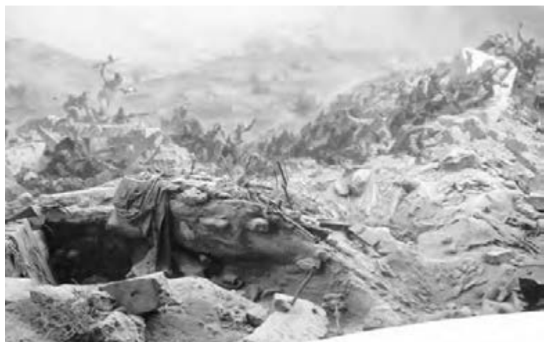
● Фрагмент диорамы. Фигура каждого участника штурма написана с достоверной точностью.

Начавшиеся сразу же после войны благоустройство кладбища и строительные работы производились на пожертвования, собранные