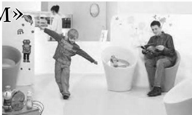
● Только художник знает, где грань между реальностью и вымыслом.

Главный критерий оценки – оригинальность и новизна воплощения, инновационность подходов, использование возможностей выбранного медиа-