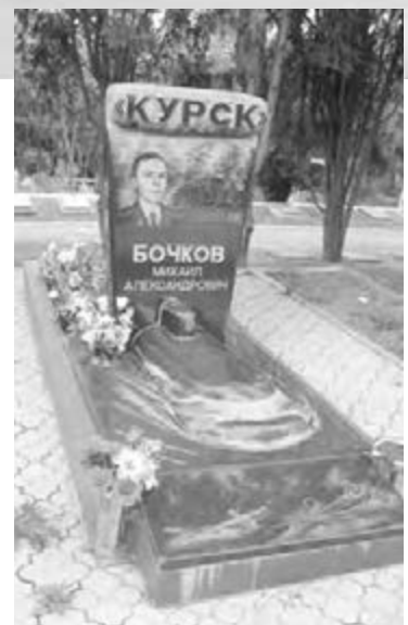
● Сюда не зарастет народная тропа.

особняком к Братскому кладбищу примыкает участок, где покоятся защитники города, павшие в годы Великой Отечественной войны, и моряки Черноморского флота, погибшие при исполнении служебных обязанностей уже в мирные дни. Здесь же нашли свое последнее пристанище моряки с печально известным линкора «Новороссийск» и субмарины «Комсомолец». В молчании мы постояли у скульптурной композиции «Родина – сыновьям», увенчанной двенадцатиметровой фигурой скорбящего матроса, и, уже направляясь к выходу, на несколько минут застыли возле одной из могил. Выбитый из черного мрамора фрагмент подводной лодки с надписью «Курск» и молодое, почти мальчишеское лицо на плите... В груди в очередной раз защемило от боли за всех 118 человек с затонувшей субмарины, память о которых навсегда останется в холодных водах Баренцева моря и в горячих людских сердцах.